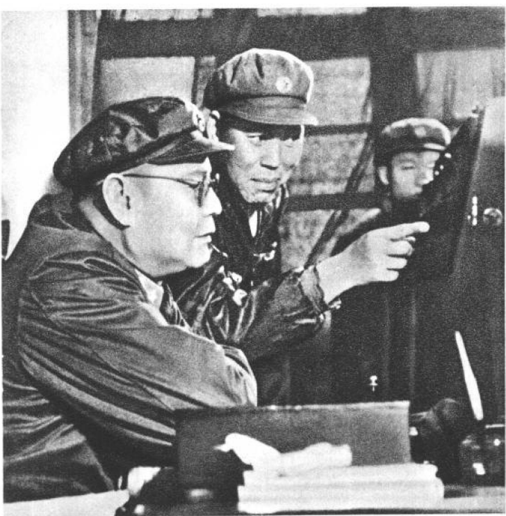
一九六一年六月，叶剑英副主席视察人民解放军航空兵某部时，观察飞机射击练习器。