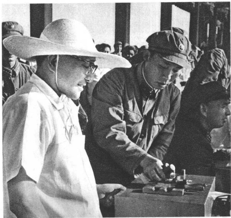
一九六四年六月，邓小平副主席观看人民解放军某部军事表演。