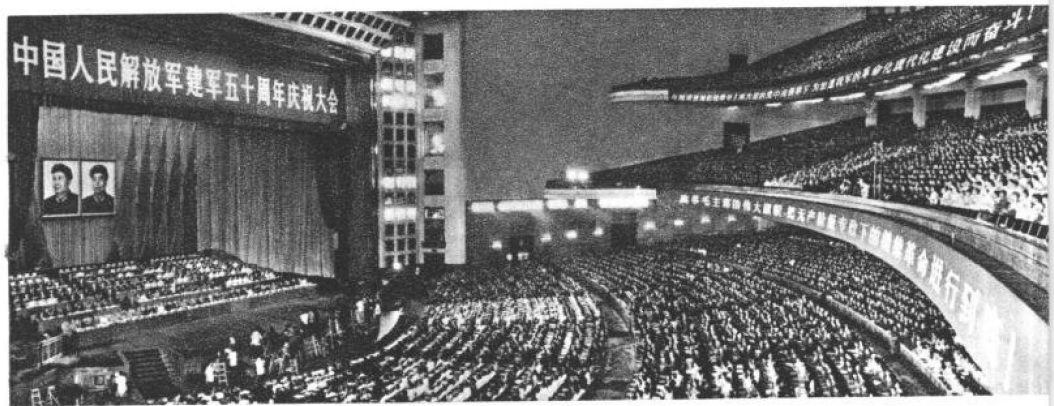
图为庆祝大会会场。