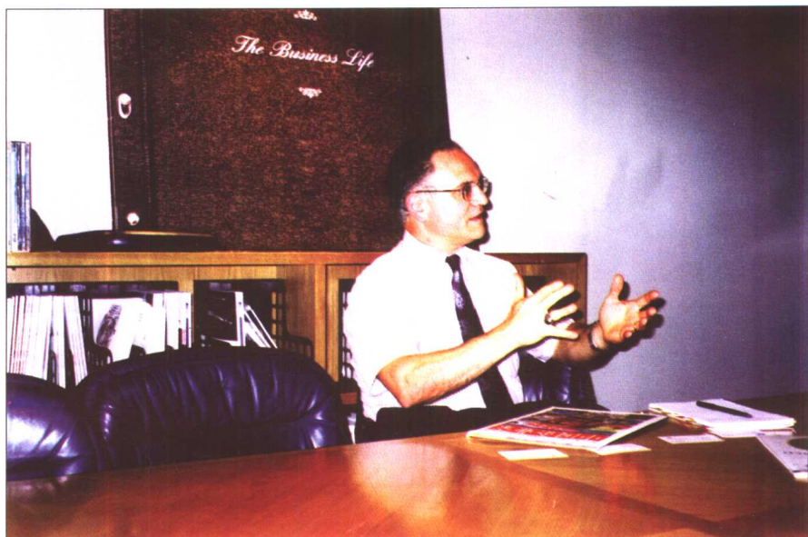
《财富》主管 500 强排名的资深编辑卡卡西先生介绍全球 500 强评选情况