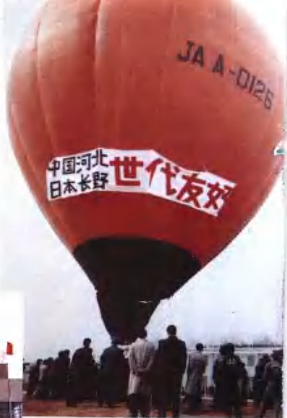
▲ 热气球 〔齐大征〕