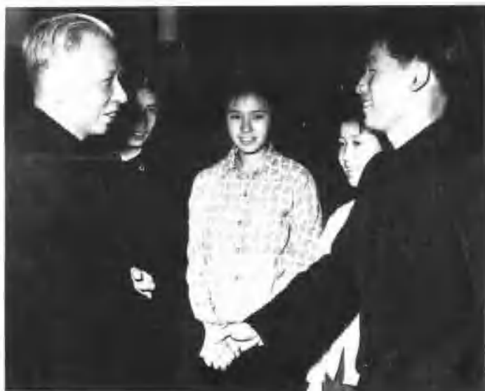
▲ 刘少奇接见河北游泳运动员穆祥雄