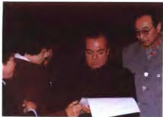
▲ 国际排联主席阿科斯塔访 问河北 〔张进〕