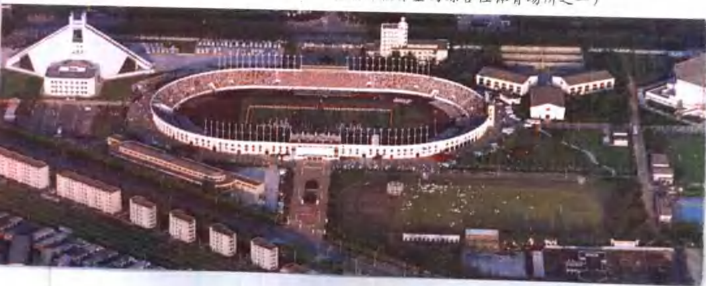
▼ 唐山体育中心(建于1984年,是河北省活 动项目较齐全的综合性的体育场所之一)