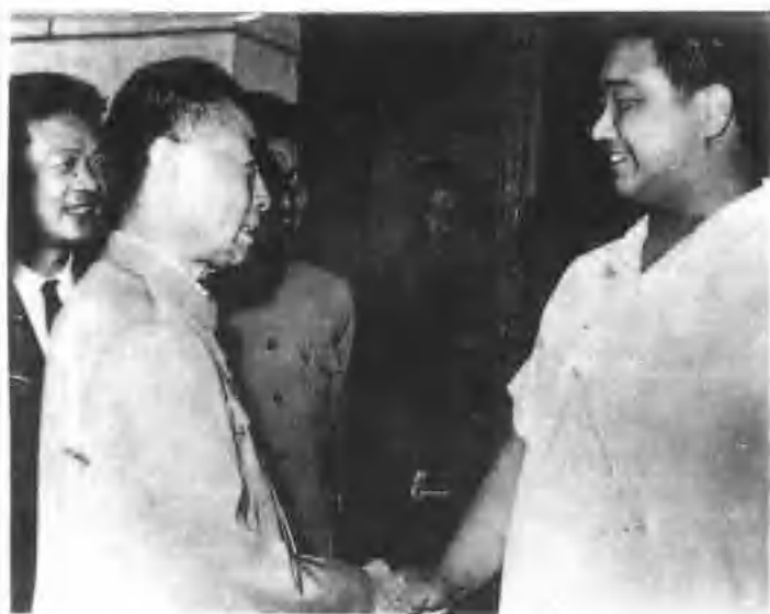
▲ 周恩来接见河北举重运动员彭广珠