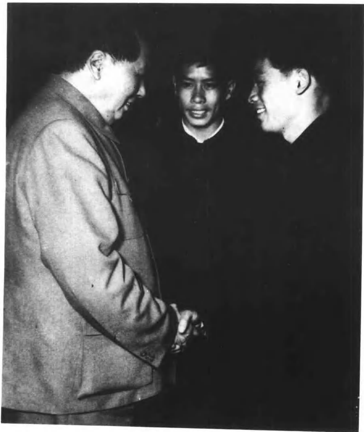
毛泽东接见河北运动员穆祥雄(1959年)