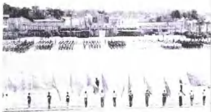
▼ 河北省第一届人民体育检阅大会(1952年·保定)