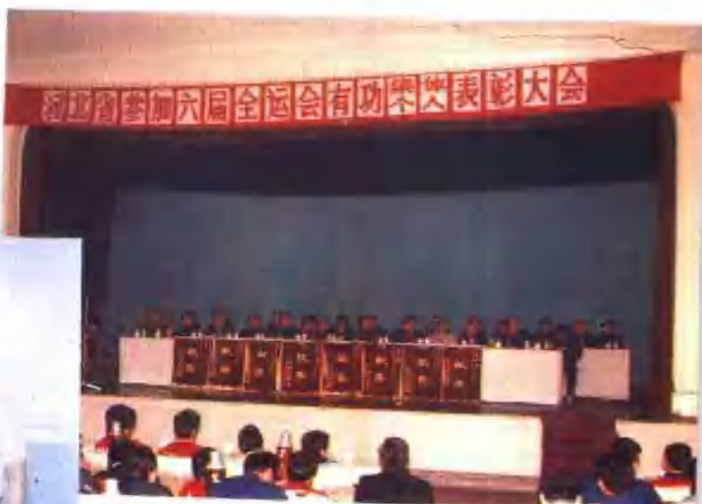
上: 河北体育代表团在第六届全国运动会上获团体总分第十名 [齐大征] 下: 河北省隆重表彰参加第六届全国运动会优秀集体和个人 [齐大征] ◀ 省体委制订新的战略规划 [罗虎生]