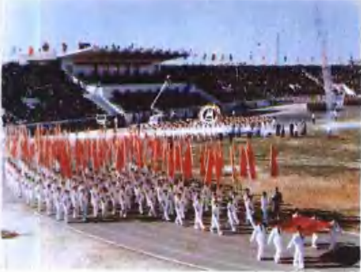
▲ 河北省第七届运动会(1987年·唐山)