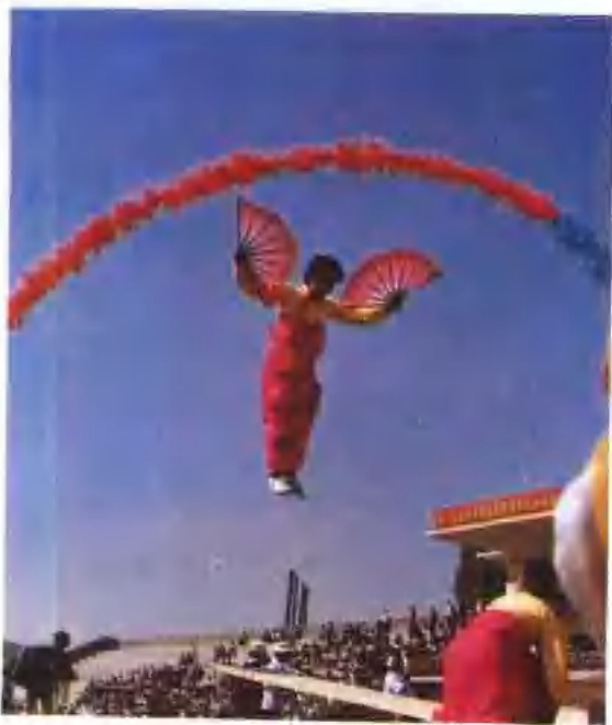
▲ 河北体育代表团参加全国少数民族运动会跳板表演(1986年·乌鲁木齐) [齐大征]