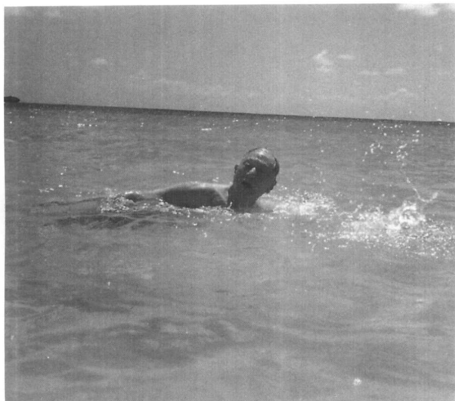
1978年顾维钧在 波多黎哥下海游泳