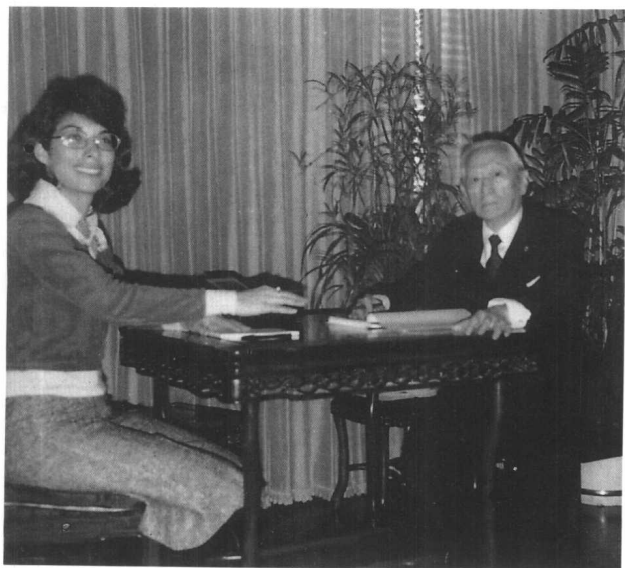
哥伦比亚大学工作人员正在为顾维钧的口述回忆录录音