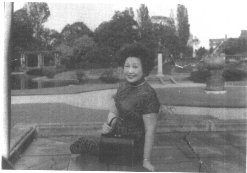
顾维钧夫人严幼韵(1959年结婚)1962年摄于荷兰