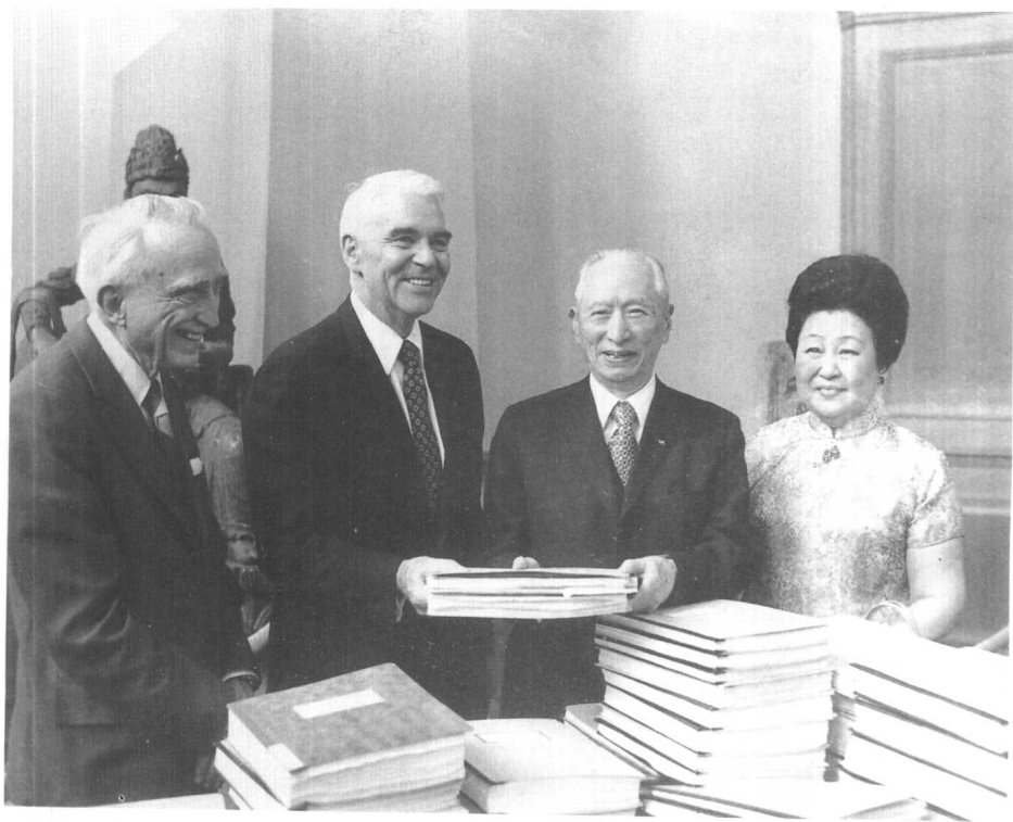
1976年5月28日顾维钧夫妇向哥伦比亚大学捐赠回忆录原稿 (左一为韦慕庭教授，左二为哥伦比亚大学校长)