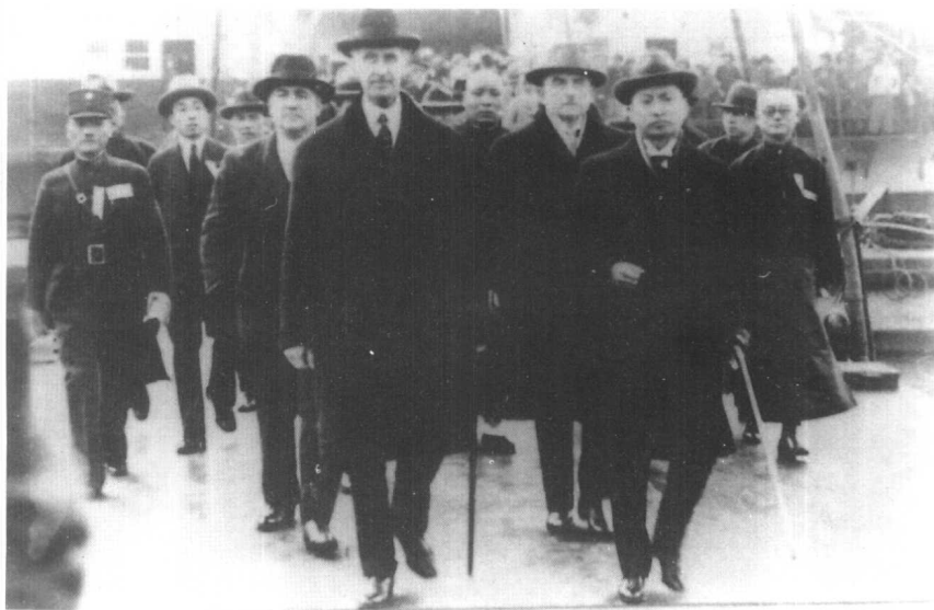
1932年顾维钧随国联李顿调查团到大连(前右一为顾维钧)