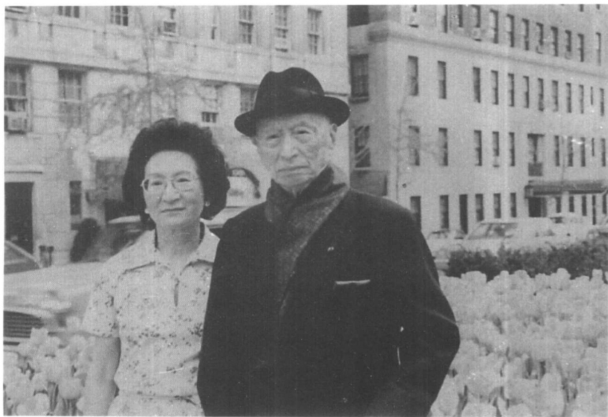
1983年顾维钧与女儿顾菊珍在纽约街上散步