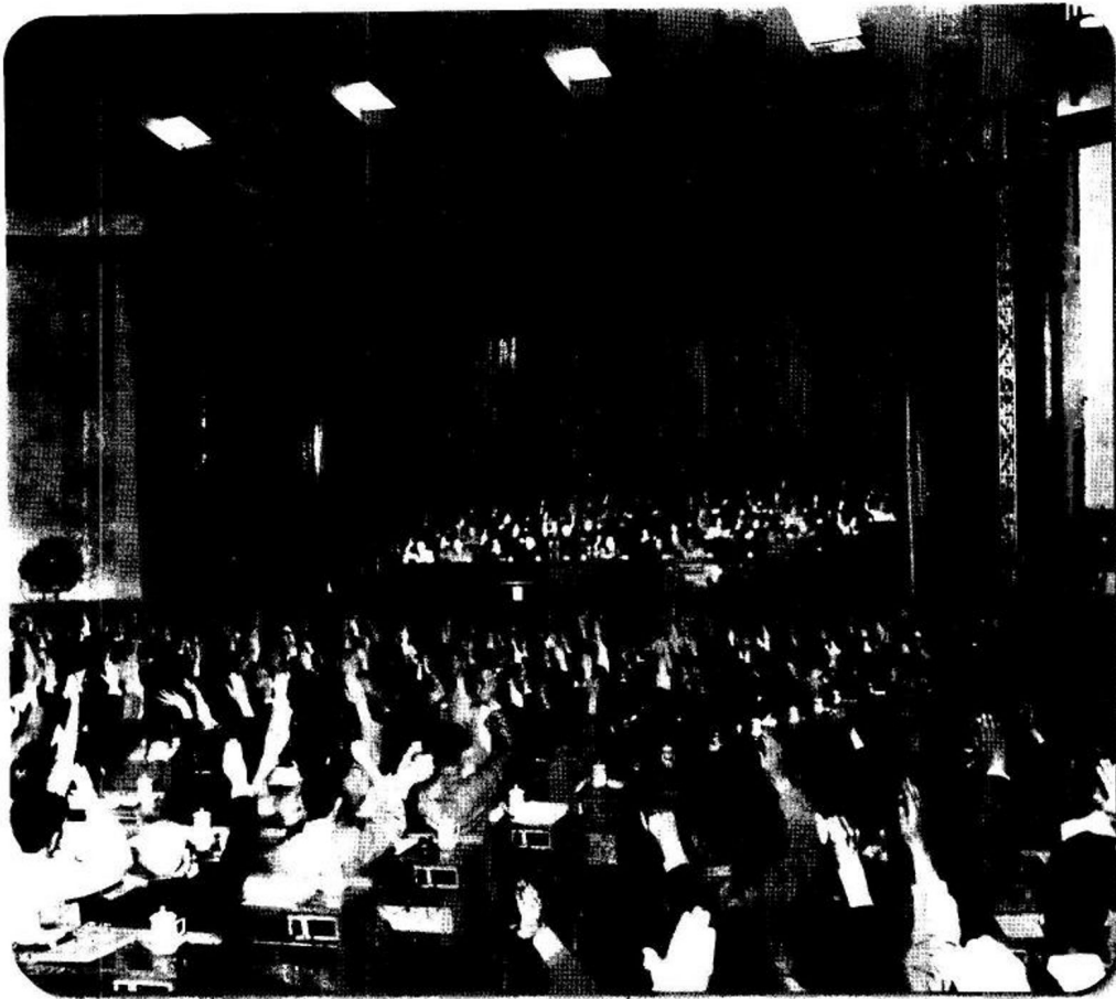
◀ 1958年5月，中共八大二次会议在北京举行。会议正式通过了「鼓足干劲，力争上游，多快好省地建设社会主义」的总路线。