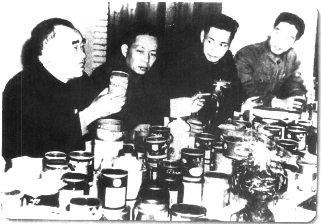
▼ 1958年4月6日，中共中央副主席朱德到上海益民食品一厂视察。