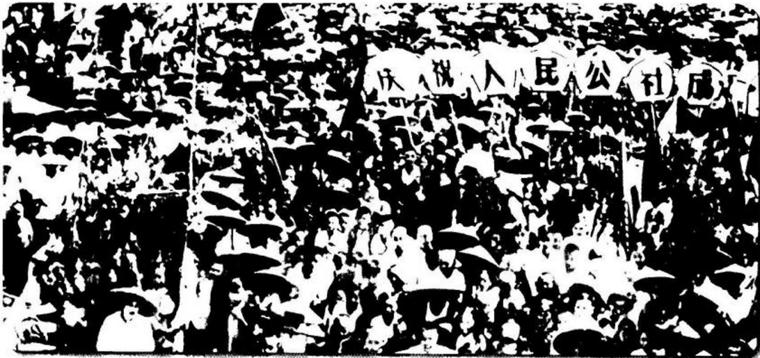
▲ 从1958年夏季开始，短短几个月时间，全国74万多个农业生产合作社合并成2.6万多个人民公社。入社的农民有1.2亿多户，占全国总农户的99%以上。图为湖南宁乡县某人民公社成立大会。