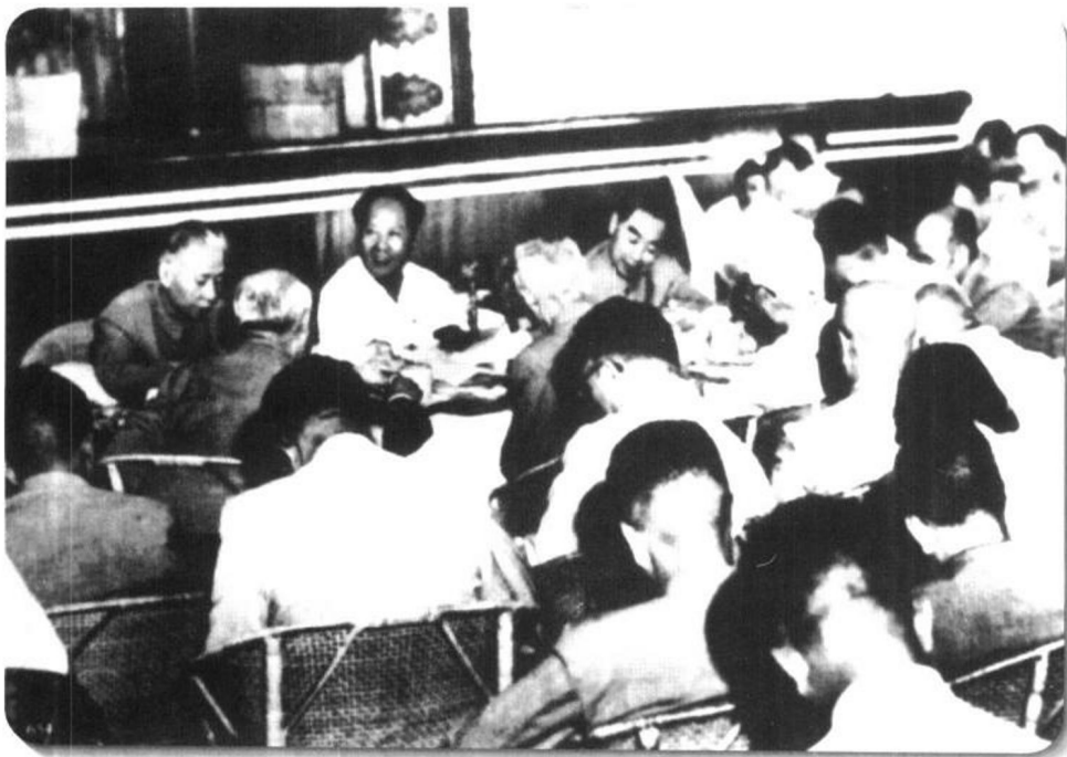
◀ 1959年8月2日，中共中央在庐山举行八届八中全会。会议进一步开展了对彭德怀等人的斗争，并提出右倾已成为工作中的主要危险。图为全会会场。