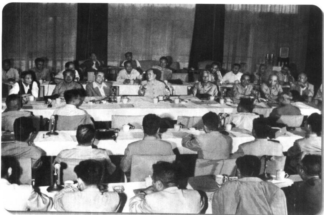
▲ 1960年6月，中共中央政治局扩大会议在上海举行。会议期间，毛泽东主席写了《十年总结》一文，对我国十余年来社会主义革命和建设进行了回顾。