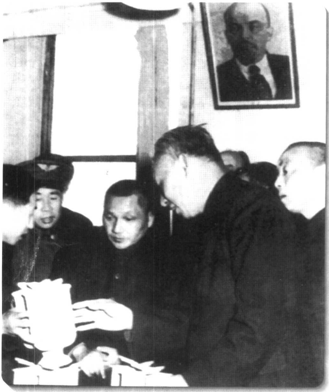
◀ 邓小平陪同刘少奇视察沈阳飞机制造厂。