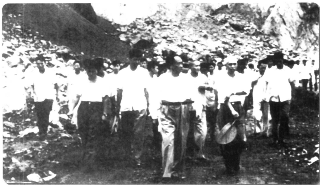
▲ 毛泽东主席视察大冶铁矿。