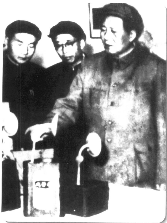
◀ 1958年，毛泽东主席在武汉展览馆轻工业品展厅武汉电池厂展位前，询问大众牌空气矿电池的性能。