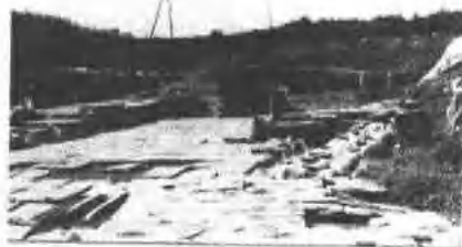
凤凰嘴金中都城遗址