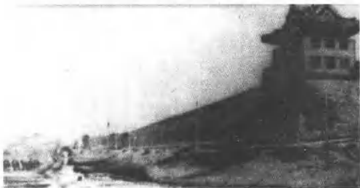
外城角楼、城垣及马面