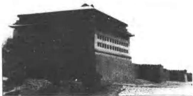
内城角楼、城垣及马面