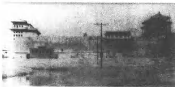
内城西直门瓮城、城门楼、 瓮城门楼、箭楼、护城河