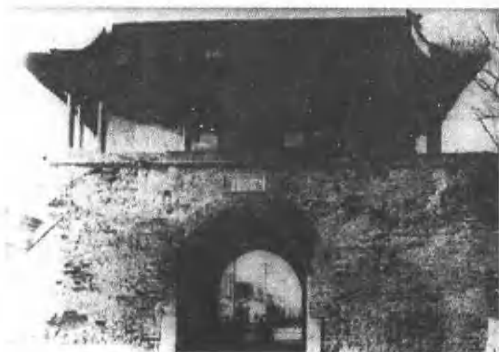
外城右安门城门楼