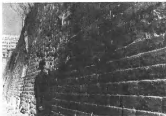
作者在查看明代城墙