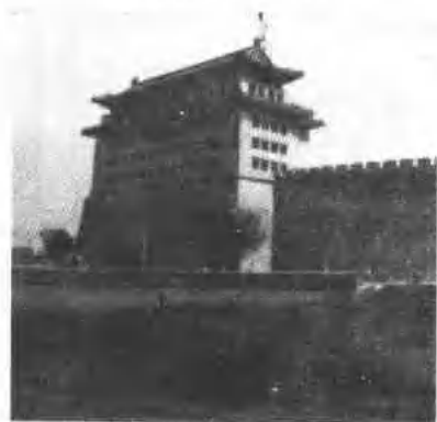
修葺一新的德胜门箭楼