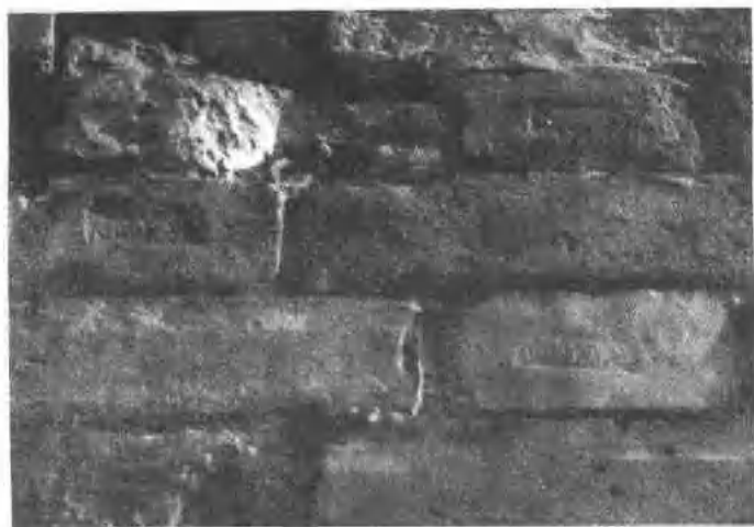
印有窑名的明代城砖