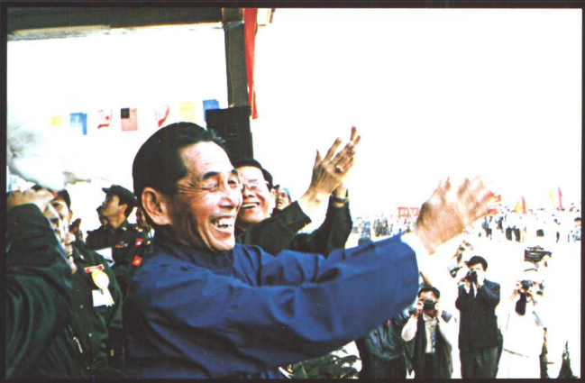
彭家声主席与缅甸国家领导人 钦纽中将放飞和平鸽