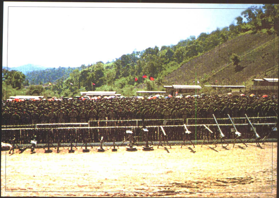
坤沙孟泰军(MTA)决胜支队集体投降缅中央政府