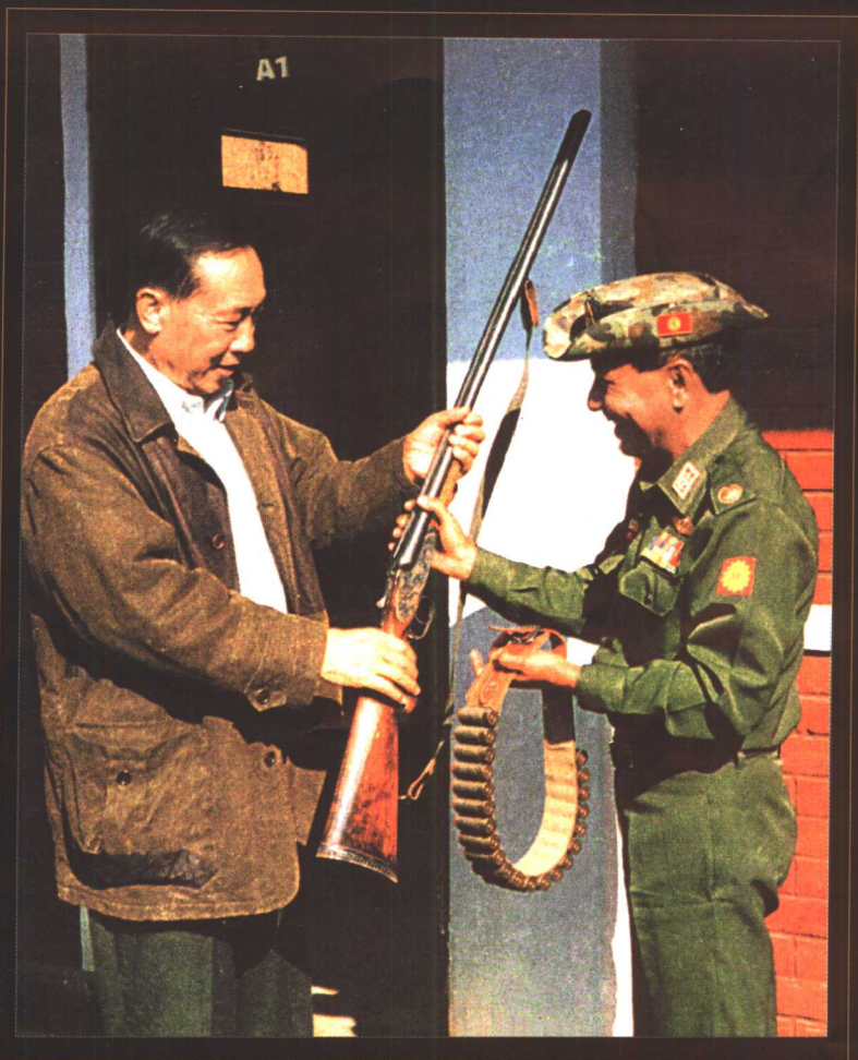
1996年1月7日吴坤沙(左)在官邸接受了缅甸中央政府代表貌丁少将(右)赠送的猎枪。标志着缅甸最大的反政府孟泰军(MTA)响应民族和解政策,实现武器换和平。孟泰军(MTA)精锐改编为直属缅中央政府领导的缅甸国防野战警察部队。