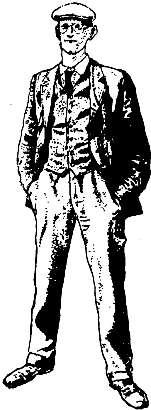
罗宾·杰克斯为 《一个青年艺术家的画像》作的插图(下同)