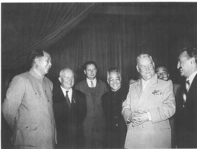
毛泽东、赫鲁晓夫、布尔加宁、米高扬在北京的宴会上。1954年。