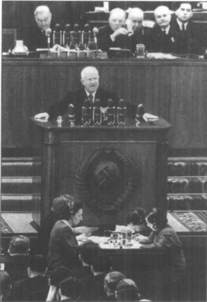
赫鲁晓夫在苏共第二十次代表大会上。1956年。