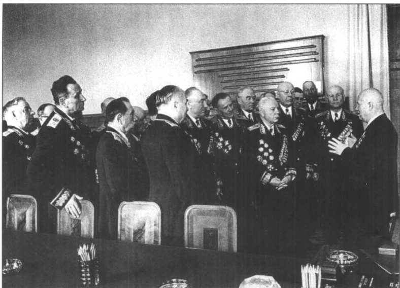
赫鲁晓夫与苏军高级将领在一起。