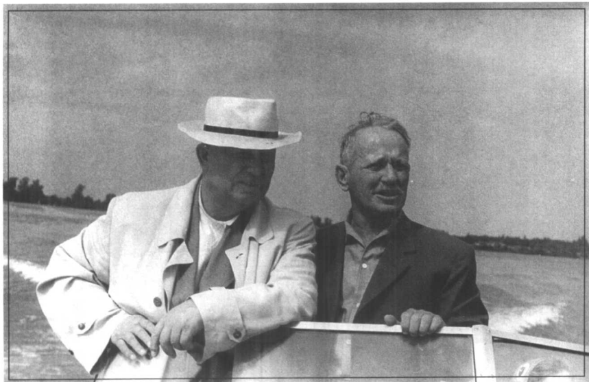
与作家肖洛霍夫乘快艇游顿河。