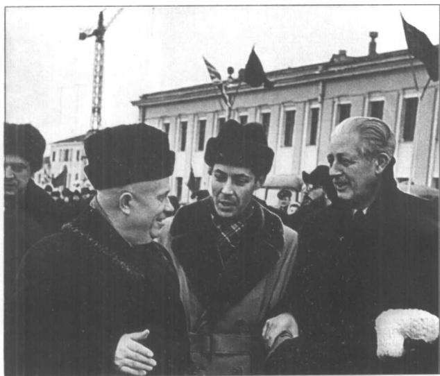
赫鲁晓夫与英国首相麦克米伦（右）。1959年。