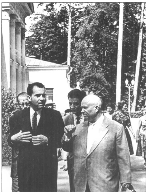
1959年夏天，尼克松副总统前往苏联参与美国展览会事宜。