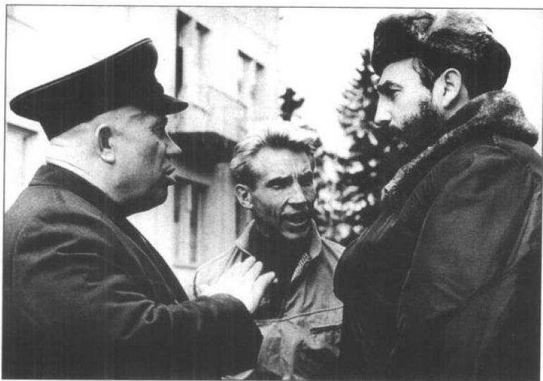
赫鲁晓夫与菲德尔·卡斯特罗于扎维多沃。1963年。