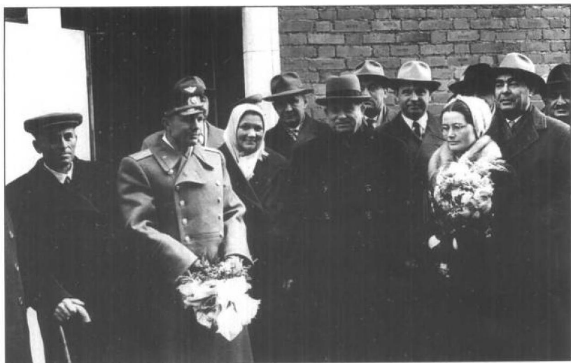
苏共中央领导人与登上太空第一人加加林及其父母在一起。