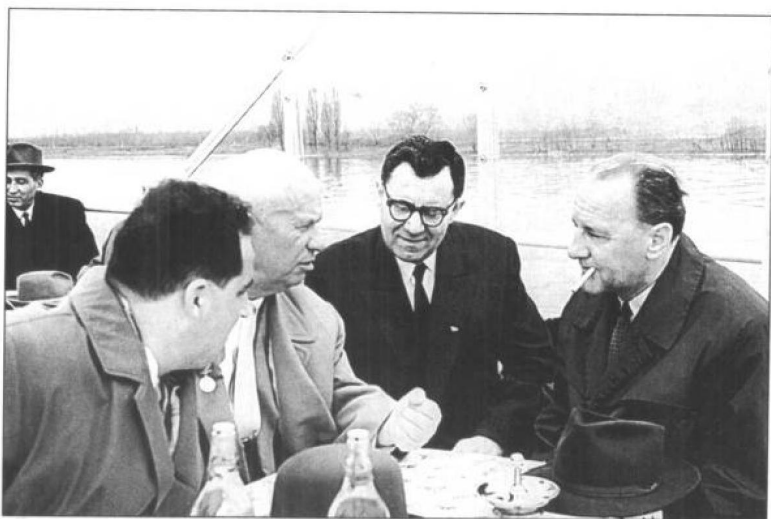
赫鲁晓夫、葛里米柯和匈牙利社会工人党中央第一书记卡达尔在布达佩斯多瑙河畔。