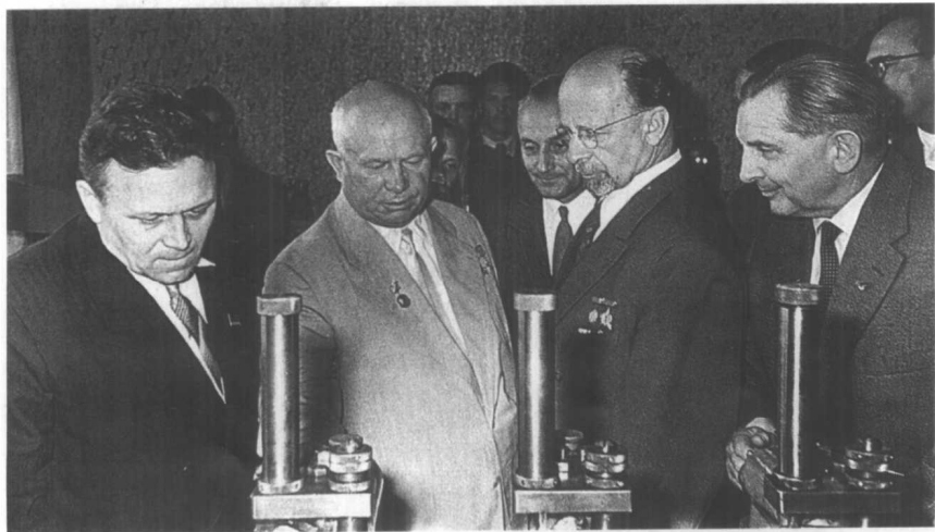
赫鲁晓夫与德国统一社会党中央第一书记乌布利希参观工厂。1963年7月。