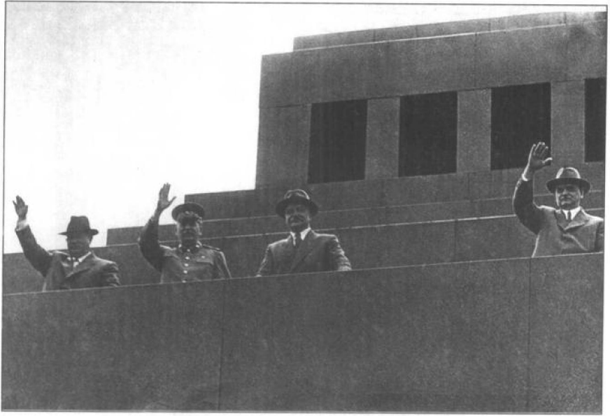
莫斯科市委和州委第一书记赫鲁晓夫、斯大林、莫洛托夫和什维尔尼克在陵墓主席台上。1952年。