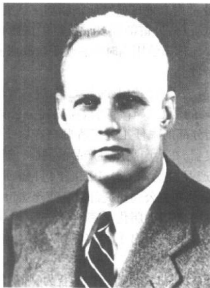
奥尔顿·爱德华·贝雷

奥尔顿·爱德华·贝雷 1907 年出生于美国得克萨斯州的中部,四十六年后逝世于田纳西州的孟菲斯。在其短暂的职业生涯中,贝雷 在油脂科学技术上留下了无人比拟的足迹。在其众多成就中,传世之作——《贝雷:油脂化学与工艺学》无疑是最重要的。该书于 1945 年首次出版后,立即成为油脂工业的金科玉律,时至今日依然如此。为了纳入更新的科学发现和工程发展,在他去世后,该书也历经数次更新与增补。然而在详细阅读此书 1945 年第一版时,读者几