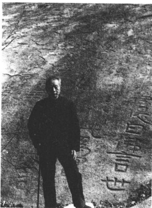
1985年作者在泰山经石峪