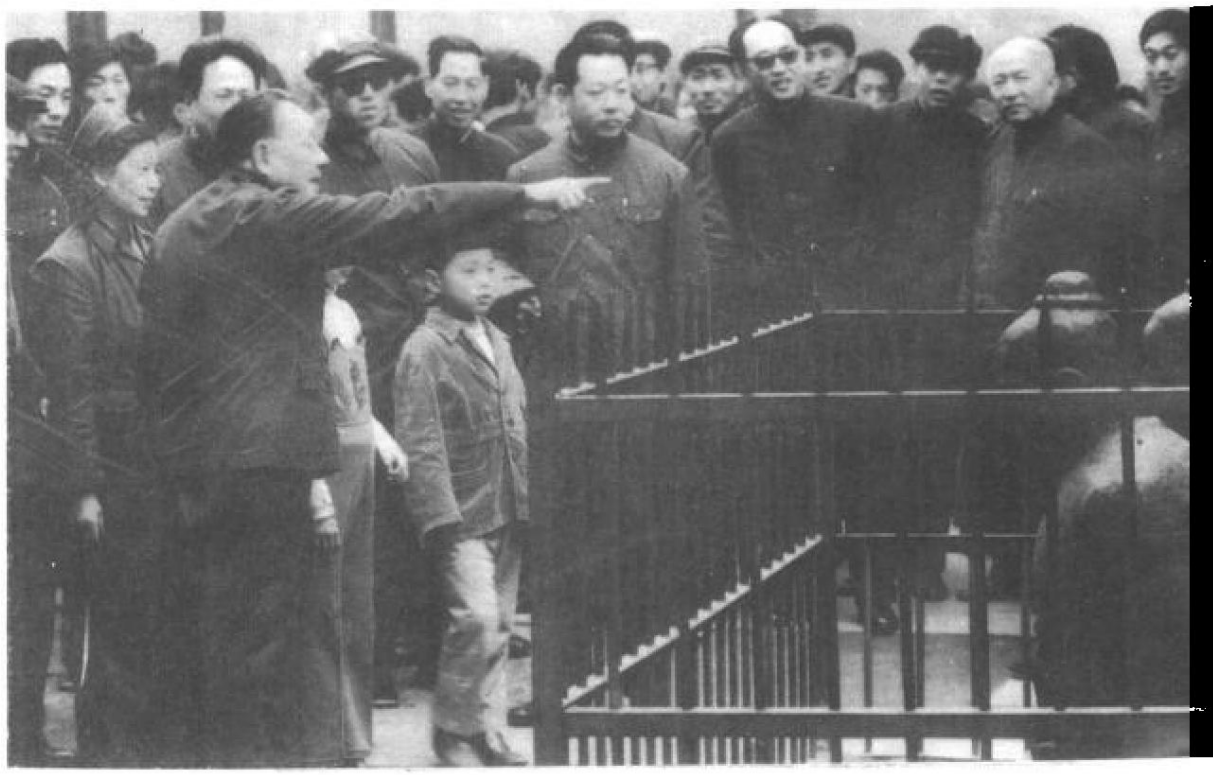
邓小平在讲故事。(1959年7月)