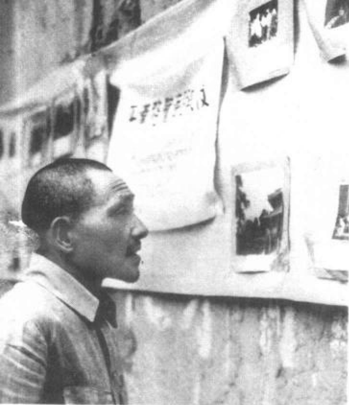
■ 邓小平参观反映部队生活的图片展览。