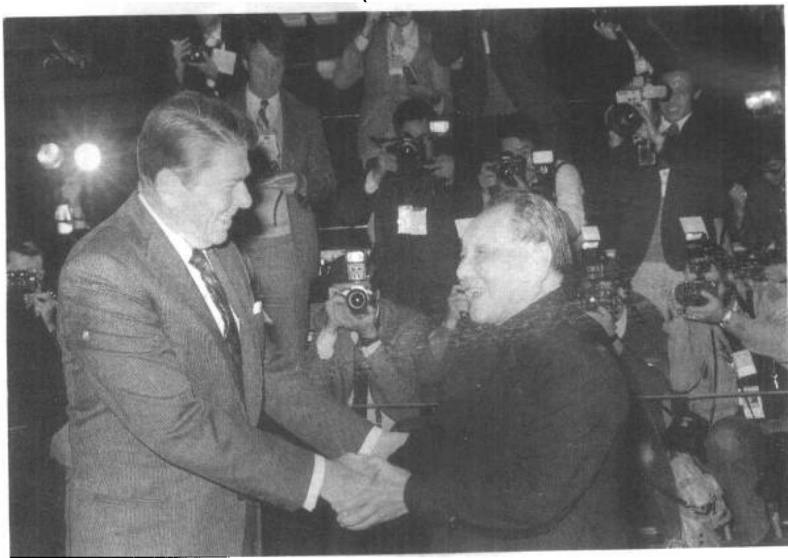
邓小平会见美国前总统里根。