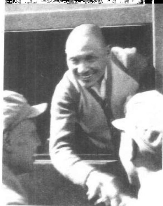
■ 邓小平乘火车途经郑州