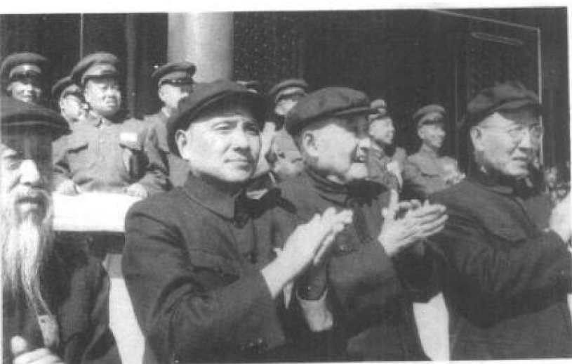
1952年国庆节，邓小平在天安门城楼上。