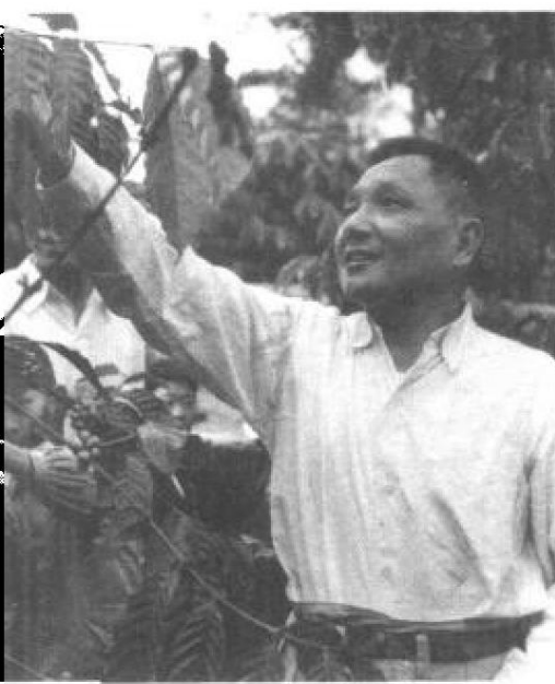
邓小平在咖啡园里。(1961年2月)