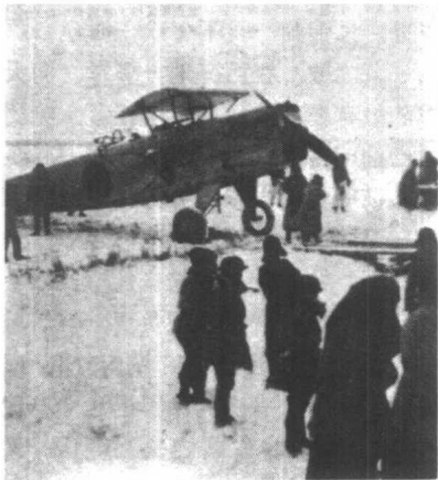
日本航空队参与进攻锦州的作战

石山站二日新联电，在此间待命中之嘉村旅团主力，本日午后零时已抵大凌河。又奉命向大凌河以西进军之某师团午后四时半抵沟帮子，全军之开入锦州已决定在明日中。又沟帮子二日新联电，锦州方面之华军总退却已完了，北宁线现在已无华军之影。营口之多门师团及北宁线之嘉村旅团，自占据沟帮子之后，迄至今日集结其主力于该地附近待命出动（嘉村旅团一日已抵大凌河左岸），今早十时接到向大凌河进军无妨之命令，是以两军当即开始向前进军，预定今日中可以开入锦州。又电，室师团主力本