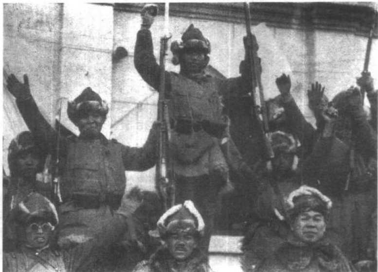
日本侵略军攻入锦州后的得意情形