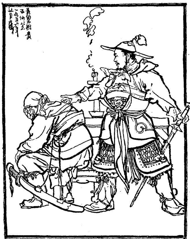
黃巢反對王仙芝投降