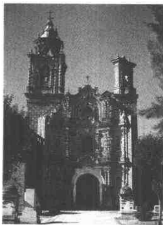
The Mission of San Francisco de Ecatepec Church

Near each mission, soldiers built a military post. The soldiers protected the mission and protected the land too.