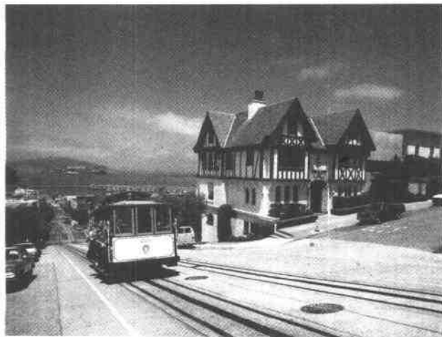
San Francisco – a view over the bay

San Francisco is an international city. People from many countries live there. Let us look at this interesting city.