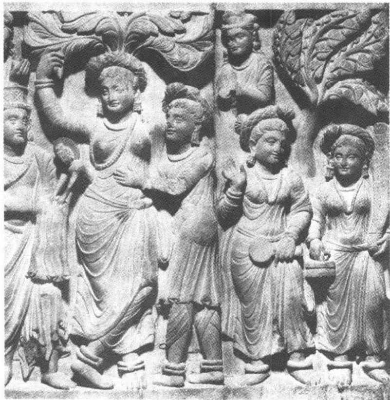
图1 蓝毗尼花园诞生：从右肋出生的释迦太子

一致认为他出自神秘的仙人瞿昙（Gotama）。其父净饭王（Cuddhadana）曾是释氏小国王或部族的一位首领，释迦氏是定居在德赖（Terai）平原，即北印度和今尼泊尔的边境地区。