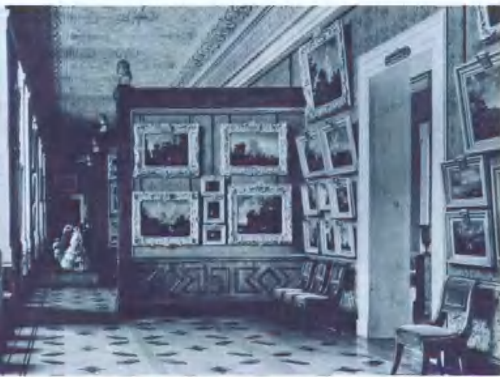
(右上、左上)革命前的艾爾米塔齊 右上是有關彼得大帝物品的展覽室。 左上是法蘭德斯 (Flanders) 派繪畫 的展覽室。