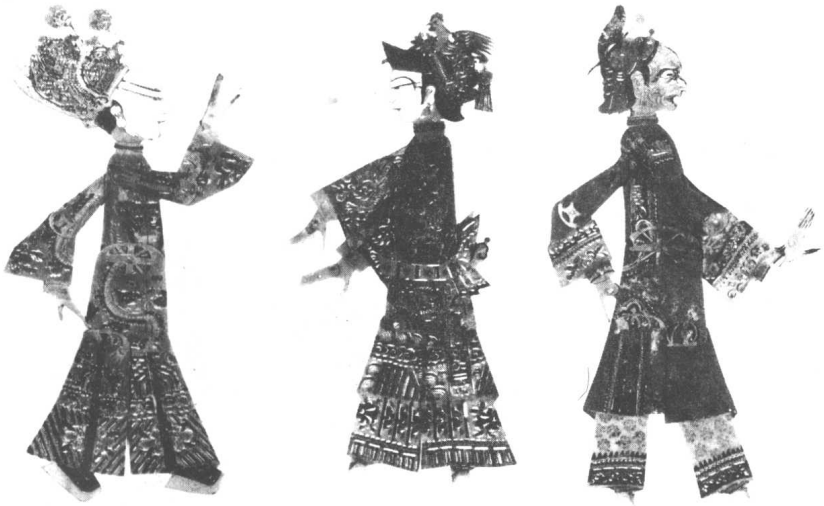
四川皮影人物造型