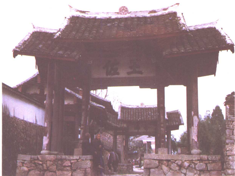
文成县刘基庙山门