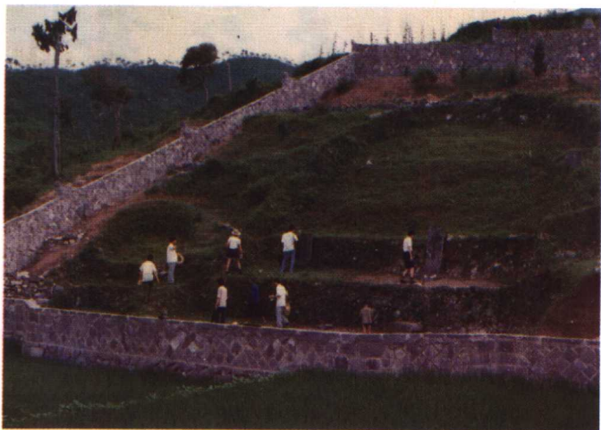
夏山刘基墓（参见正文第375页）