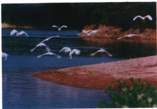
刘基故乡天顶湖一景