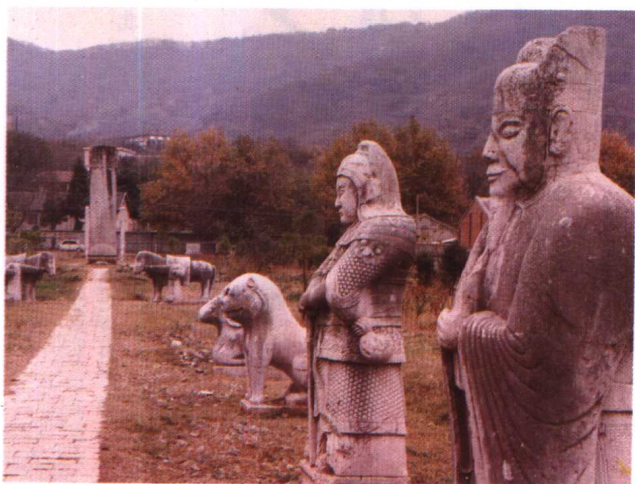
南京市郊的徐达墓