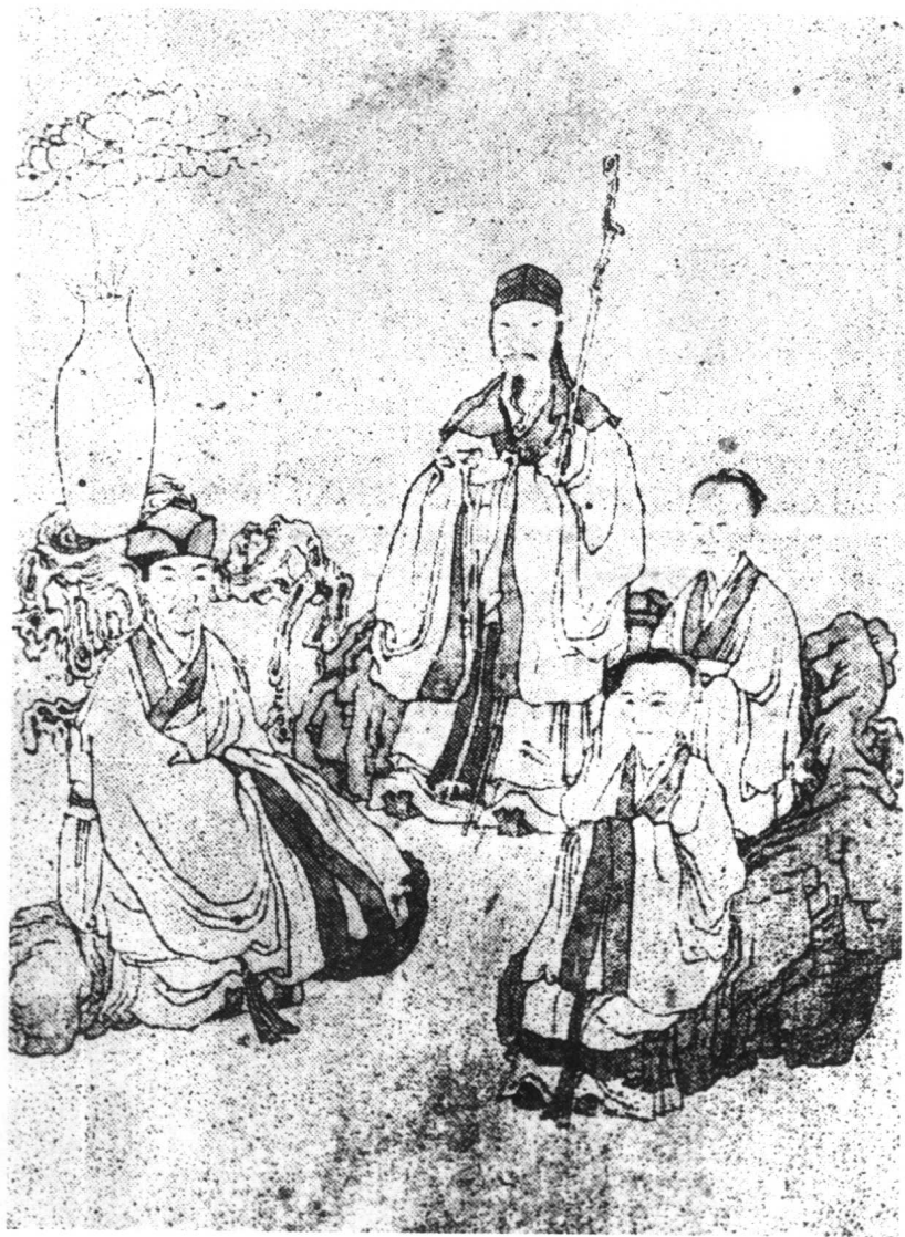
刘伯温授经图(此图画于清顺治年间,徐易象九写 面目,陈洪绶章侯画衣冠,原作现存温州市博物馆)