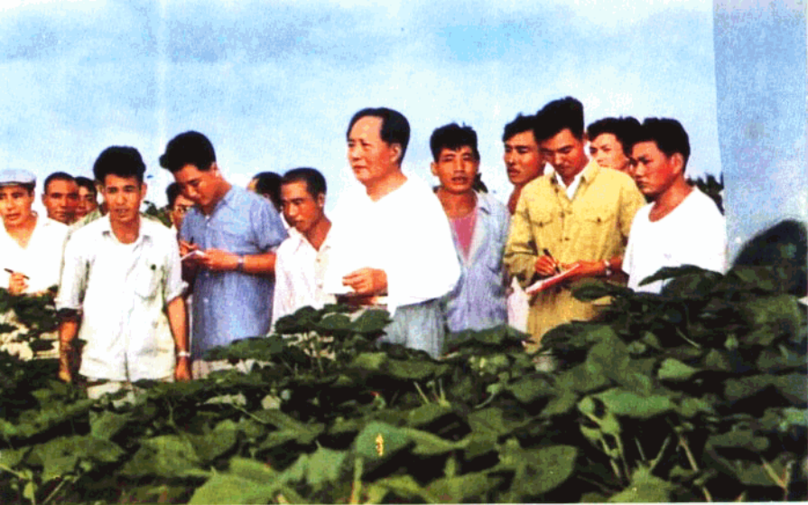
6. 毛泽东主席视察七里营，河南电台记者随同采访