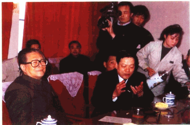
7. 江泽民总书记视察新飞冰箱厂，新闻中心记者随同采访