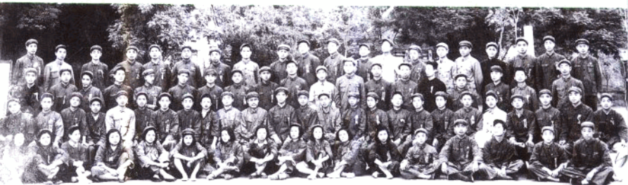
3. 河南省广播收音员首届代表会议(1951年)