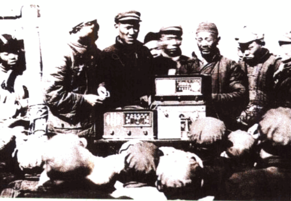
5. 听众在收听河南电台的广播(1952年)