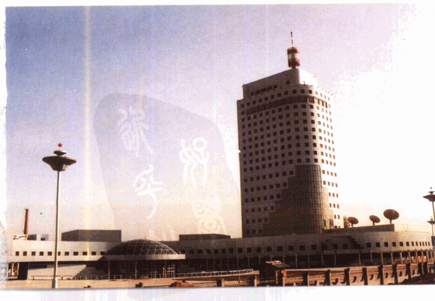
2. 河南省广播电视中心大楼(1993年)