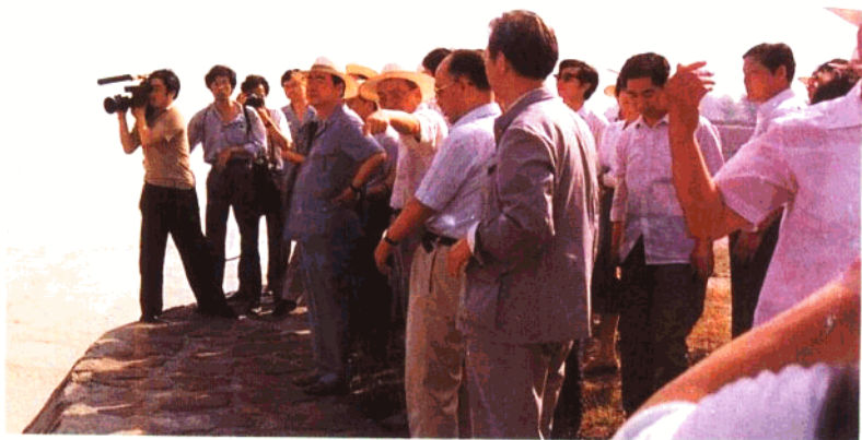
8. 李鹏总理视察黄河开封柳园口,新闻中心记者随同采访