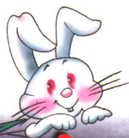
图 文 本