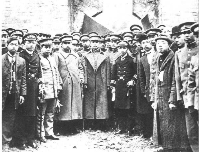
▲ 1912年2月15日,孙中山谒明孝陵。