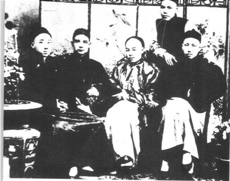
▲ 1890年前后，孙中山在香港与友人合影（前排自左至右：杨鹤龄、孙中山、陈少白、尤列。后立者是同学关心焉。）