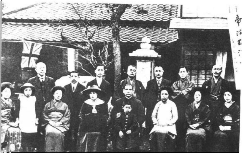
▼1916年4月9日，孙中山和革命党人在日本开会庆祝袁世凯被迫取消帝制。