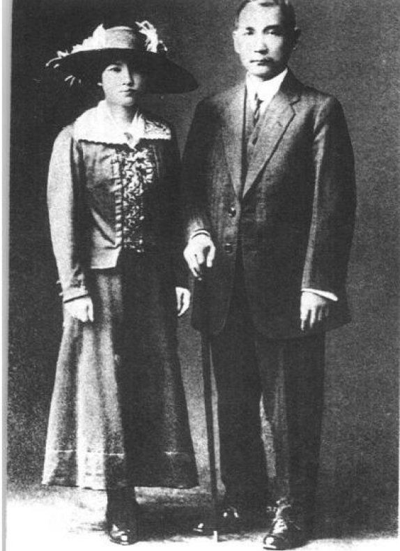
◀1915年10月25日，孙中山与宋庆龄在东京结婚。这是婚后留影。