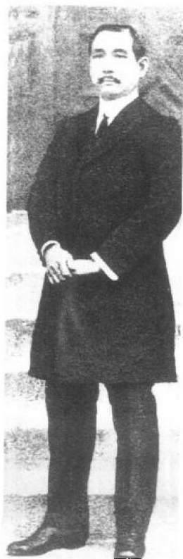
◀ 1912年，孙中山在南京总统府前。