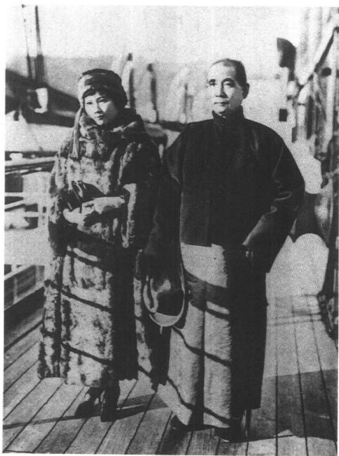
▲ 1924年12月4日，孙中山自神户乘船抵天津 与宋庆龄在船上留影。