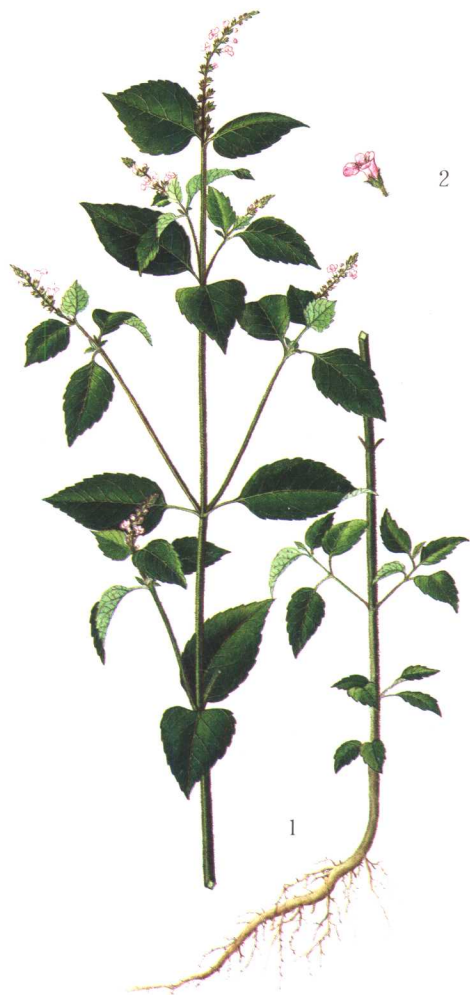
图1 小花荠苎 1. 植株; 2. 花