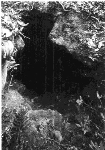
• 窰土發源地「高嶺」古礦坑。