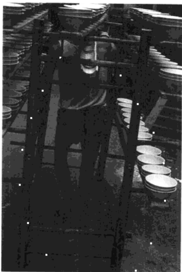
• 江西景德鎮現今製陶瓷工廠一景。