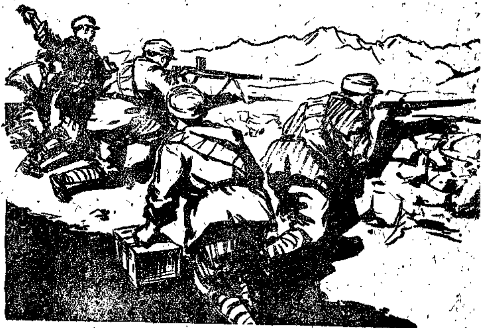
· 坚守阵地，打击敌人