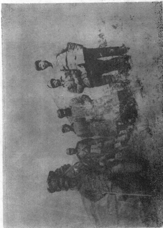
林伯渠转战陕北途中和同志们在一起