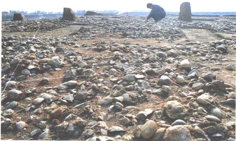
七 鸡公山遗址下文化层生活面