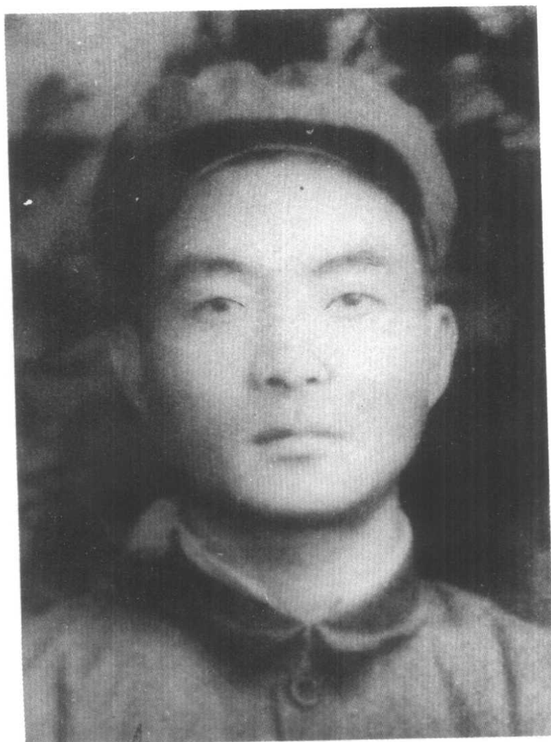
1953年,焦裕禄在河南省尉氏县参加并领导土改和剿匪。