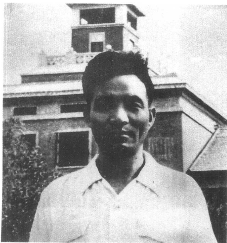
1955年夏,焦裕禄在哈工大学习和在大连实习后回到洛阳矿山机器厂。这是他在洛矿大门前留影。