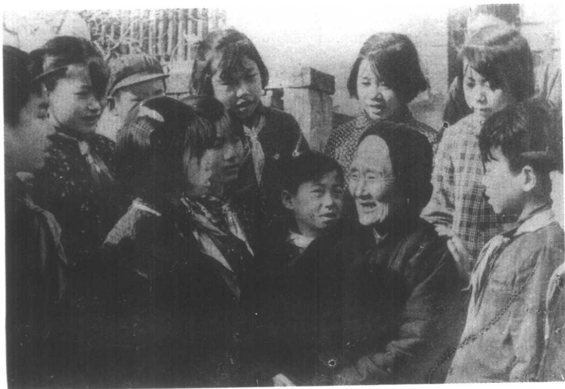
焦裕禄的母亲在给少先队员们讲述 焦裕禄青少年时代的故事。