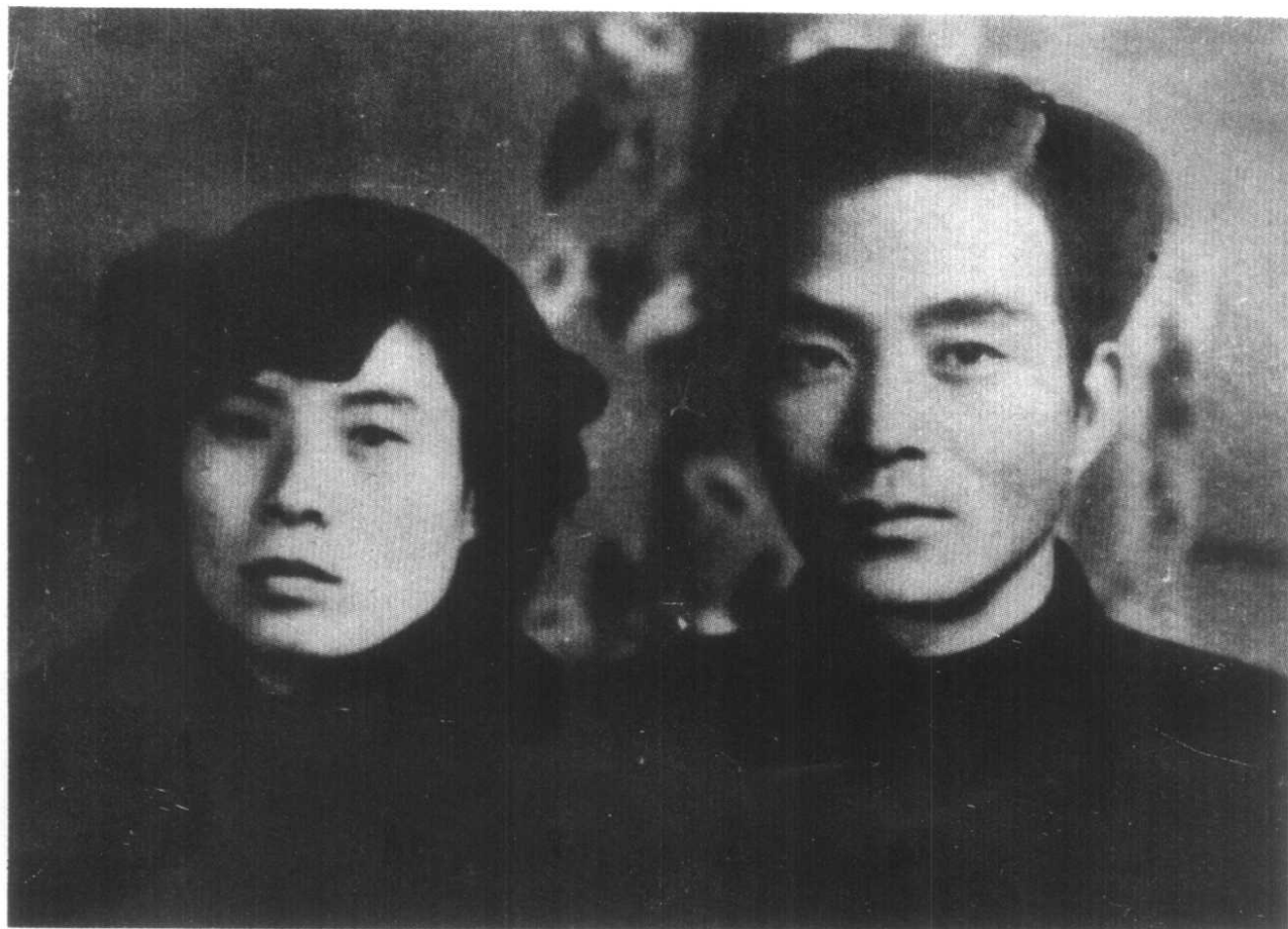
焦裕禄和妻子徐俊雅的合影。