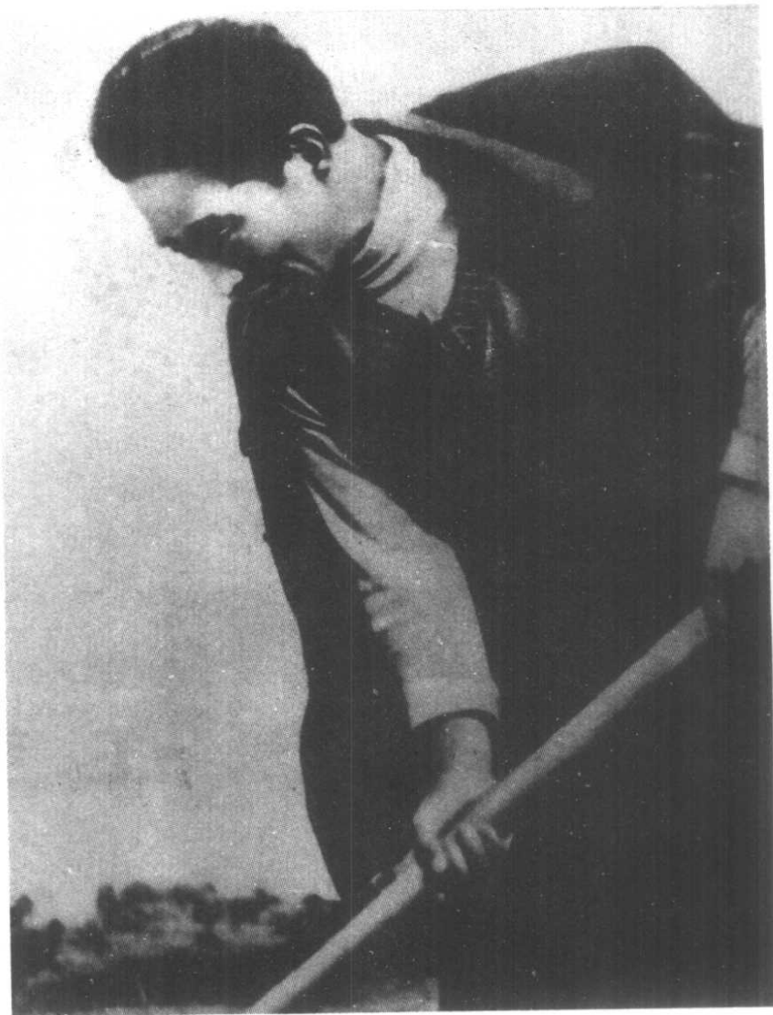
焦裕禄在田间锄草。