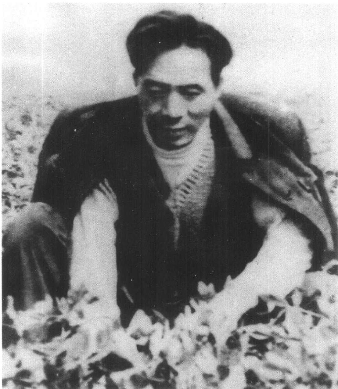
焦裕禄经常深入田间，同农民一起劳动。这是他在花生地里拔草。