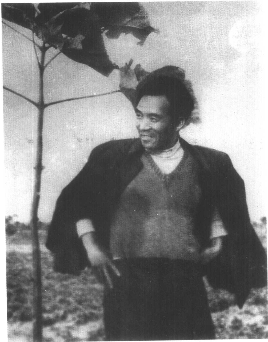
焦裕禄在他亲手栽植的泡桐树旁留影。