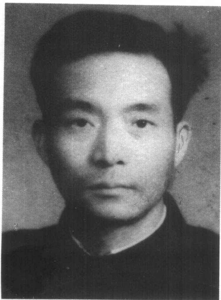
1960年,焦裕禄服从党组织的安排,又从工业战线调回农业战线。这是他在尉氏县任县委副书记时工作证上的照片。