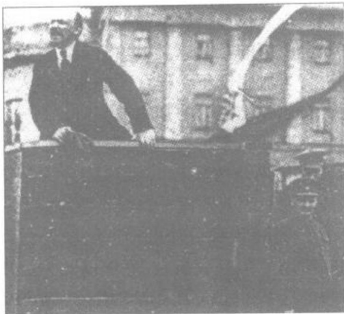
列宁在一个群众集会上发表演说

国有化，苏维埃支配、监督并负责国家的土地分配与生产、国家金融以及社会产品的分配与生产；彻底揭露临时政府正在进行的帝国主义战争的本质，推翻资产阶级统治，摆脱战争，赢得和平。《四月提纲》的提出，为布尔什维克党指明了革命的任务和斗争的方向，使俄国革命的形势骤然明朗。5月6日，布尔什维克党举行第七次代表大会，通过了《四月提纲》提出的社会主义革命路线和方针，提出“全部政权归苏维埃”的革命口号，并组成以列宁为首的新的布尔什维克党中央委员会。