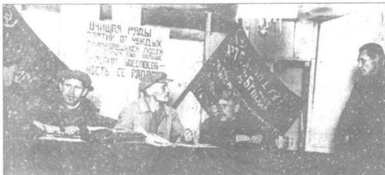
负责肃反的委员会在工作

命破坏行为，保护苏维埃政权，对怠工及经济投机行为进行惩治。以上种种措施在政治上极大地巩固了无产阶级政权，捍卫了十月革命的胜利成果。