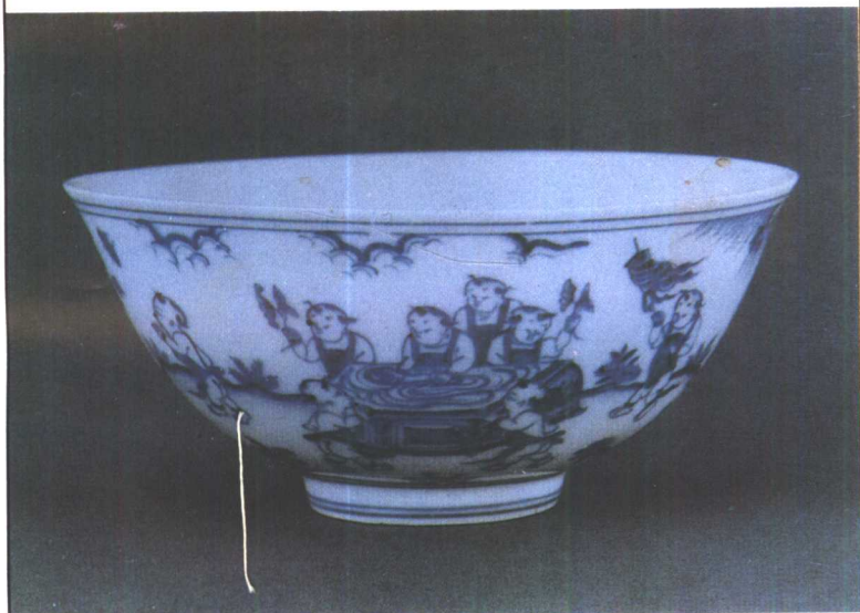
成化时期官窑烧制的青花婴戏碗