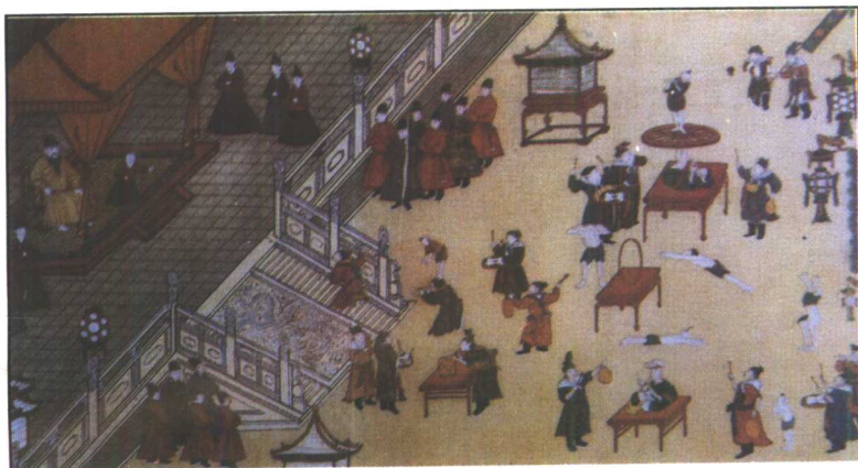
元宵行乐图卷（局部）