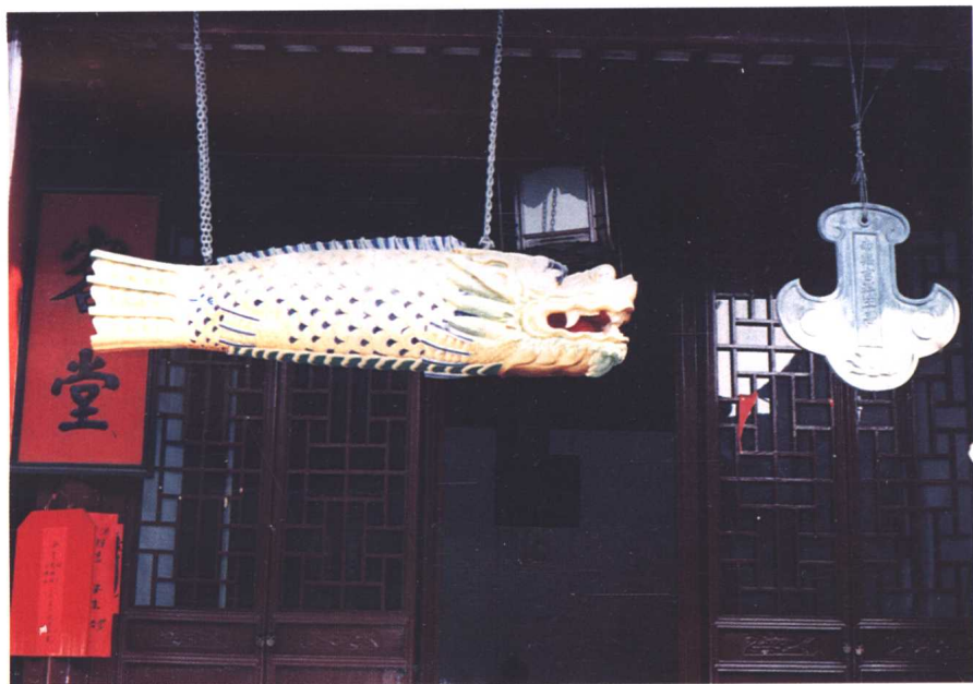
斋堂前的木鱼(梆)和斋磬