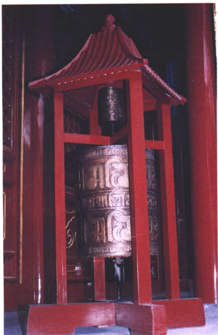
藏传佛教的转经筒