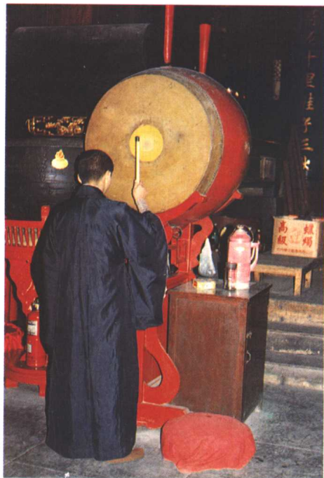
大殿中僧人击法鼓