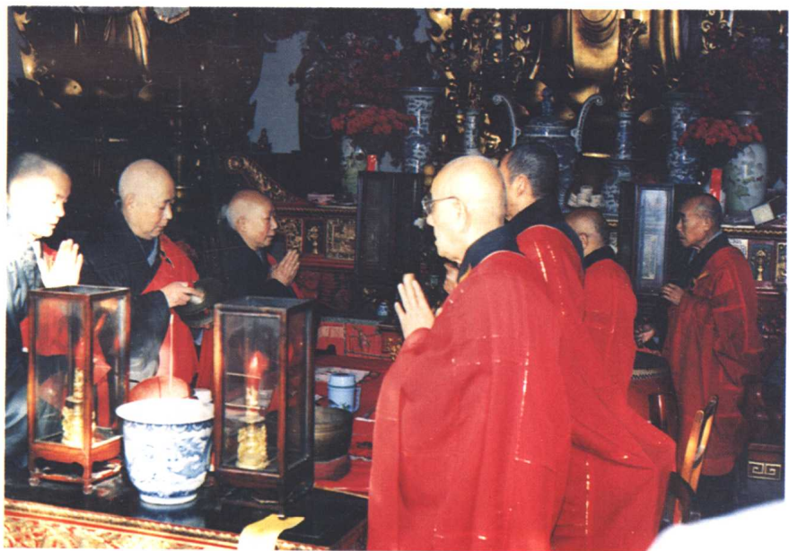
▼僧人动用鸣器作法事(放焰口)