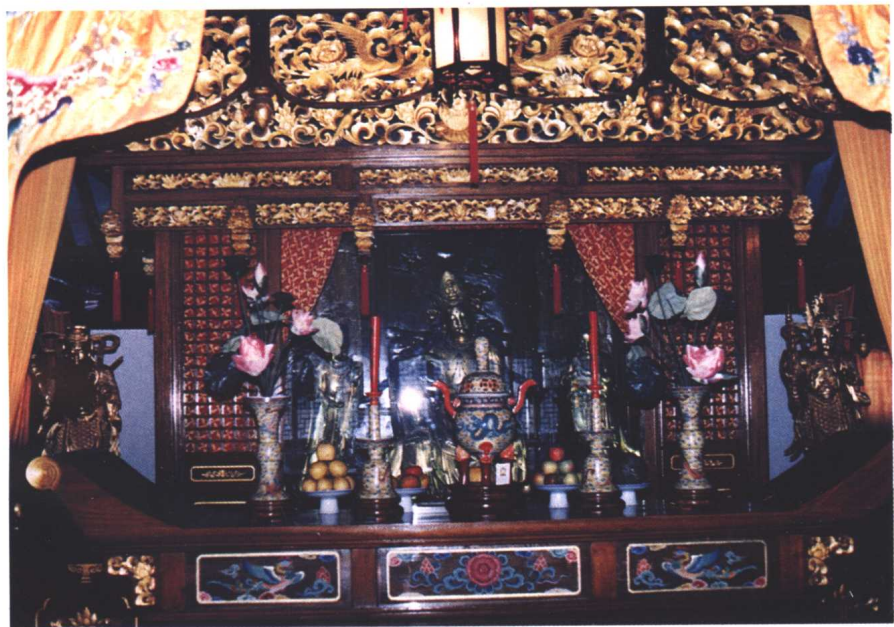
大殿中的供具与供物