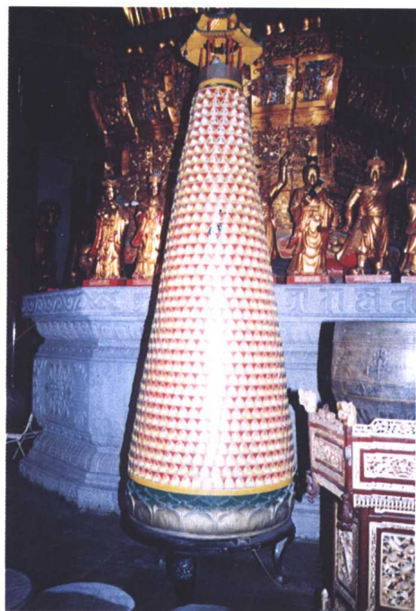
大殿中的千佛供养塔（左右各一）