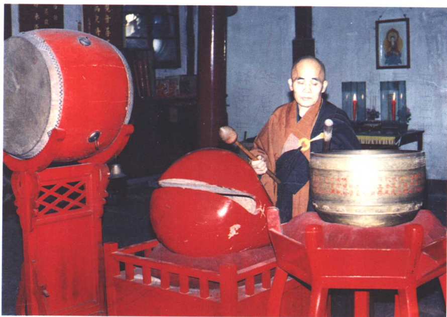
大殿中僧人同时击木鱼和磬