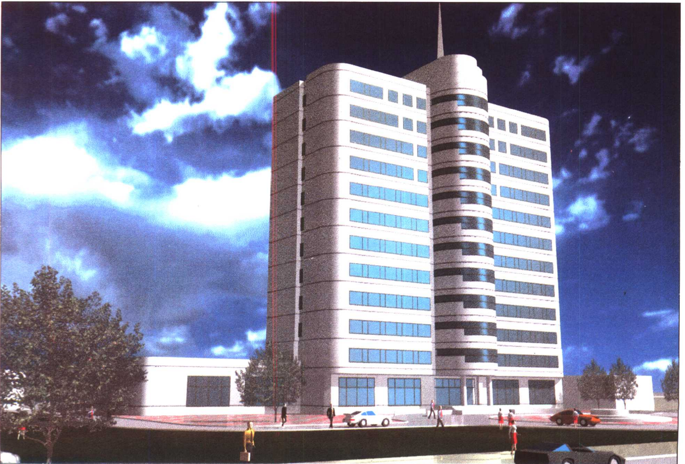
宝丰电力调度中心