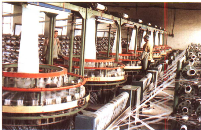
水泥厂编织袋车间