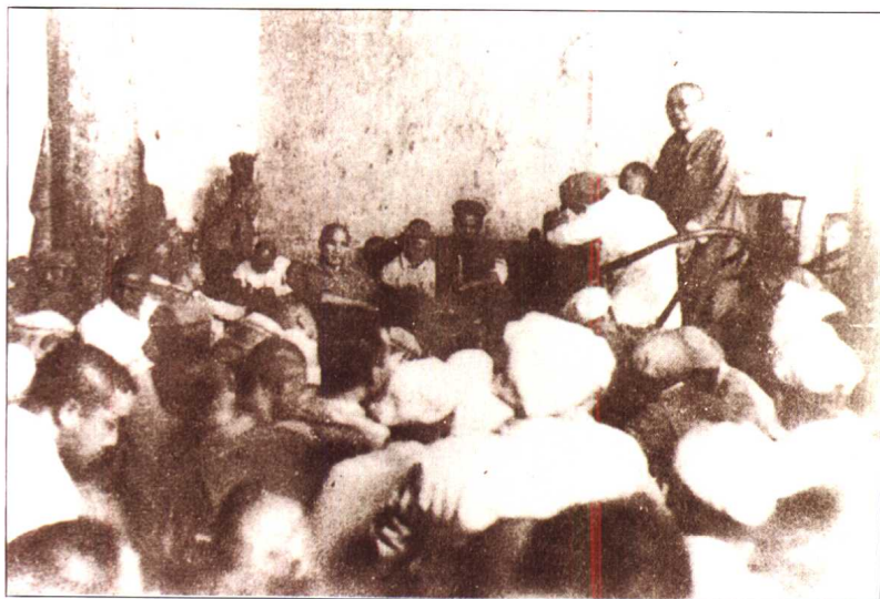
1948年刘伯承在柳林 村旅以上政工干部会议上