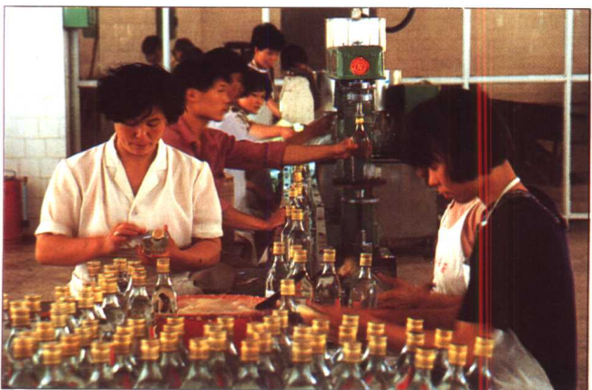
宝丰酒厂装酒车间