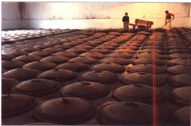
宝丰酒厂酿造车间