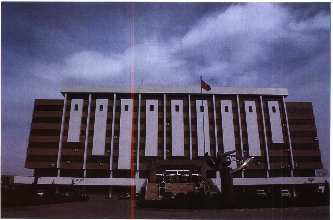
县委、县政府办公楼