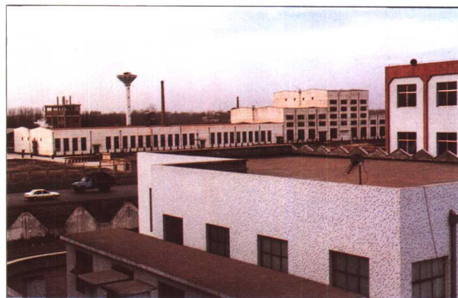
宝丰经济技术开发区一角