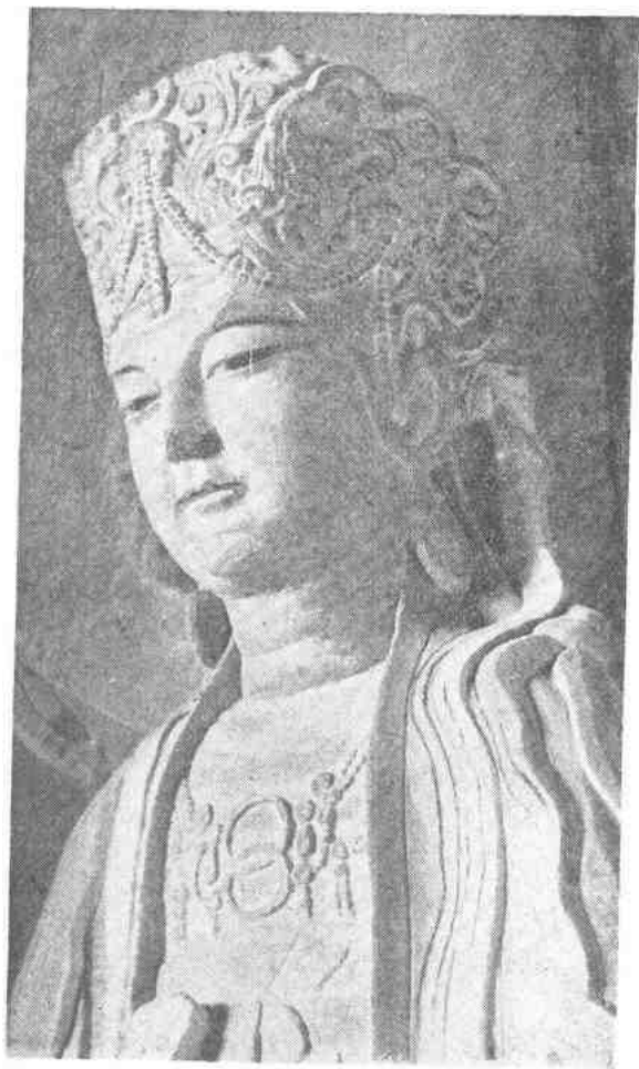
5. 普 賢 北山第136号窟(心神車窟) 高215公分

普賢是和文殊相对的一尊彫像。文殊比較庄严，普賢显得更柔和亲切一些。她的面部肌肉丰满，但样子却很清秀，这是彫刻得很成功的地方。