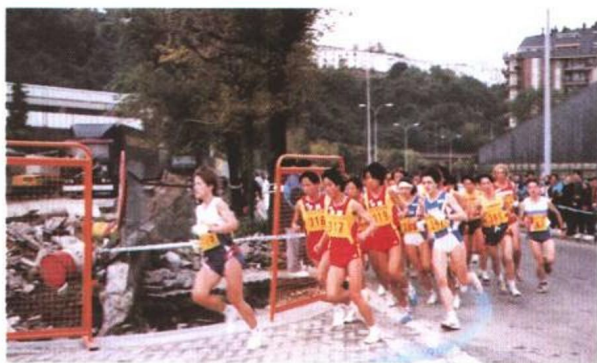
◁ 角逐在西班牙 的大街上。