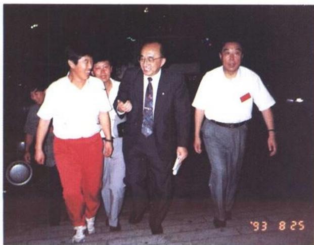
◁ 国家体委主任伍绍祖和辽宁省体委主任阎福君及马俊仁在一起。