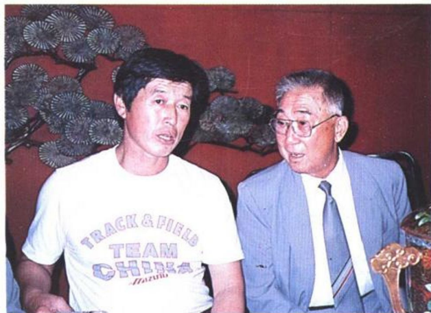
◁ 国家体委老领导荣高棠与马俊仁交谈。