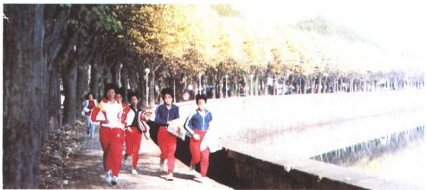
△ 他 乡。