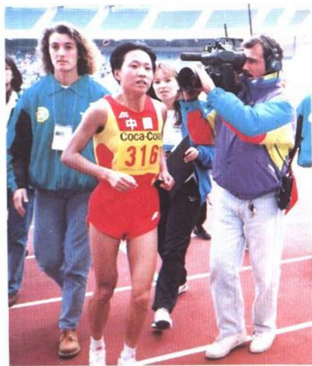
◁ 外国记者紧盯夺得第5届世界杯马拉松第一名的王军霞。