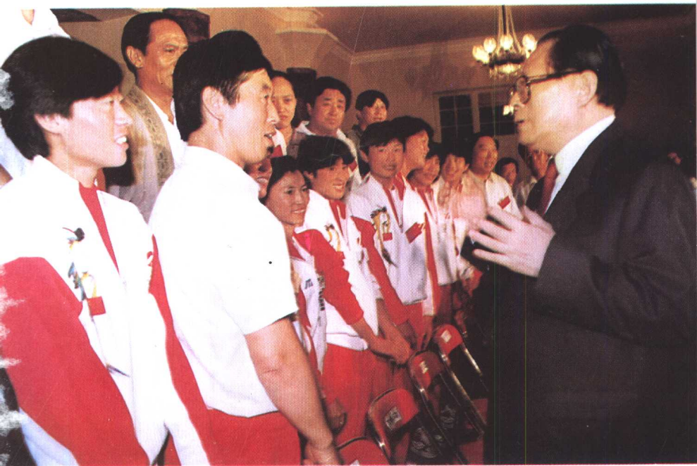
△ 中共中央总书记、国家主席江泽民在大连棒棰岛宾馆接见“马家军”成员。