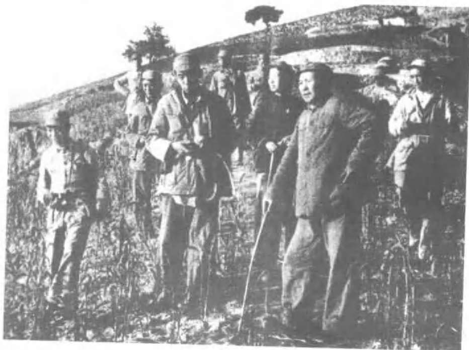
1947年，毛泽东 在转战途中。