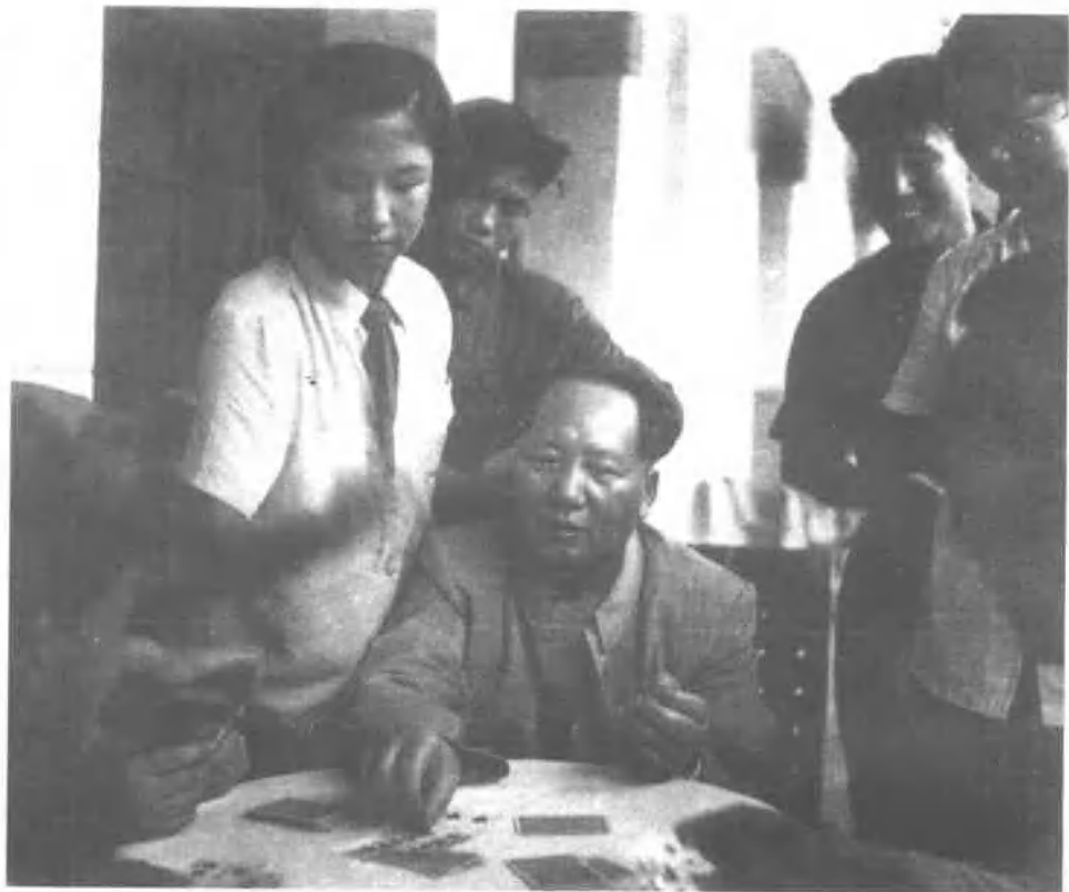
1953年9月。毛泽东和身边工作人员打扑克牌。