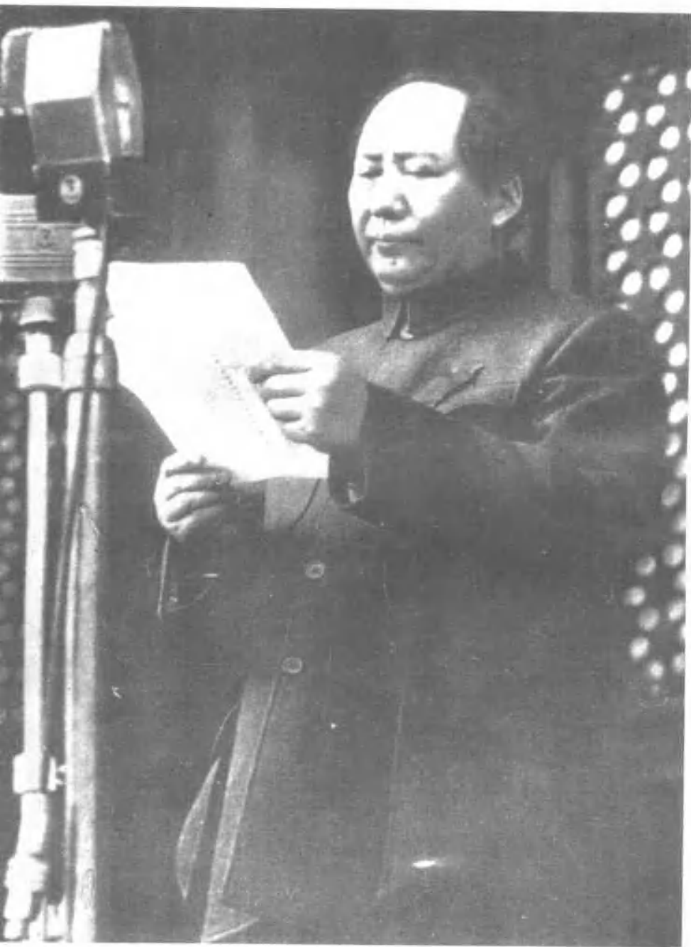
1949年10月1日，毛泽东庄严宣告中华人民共和国成立。