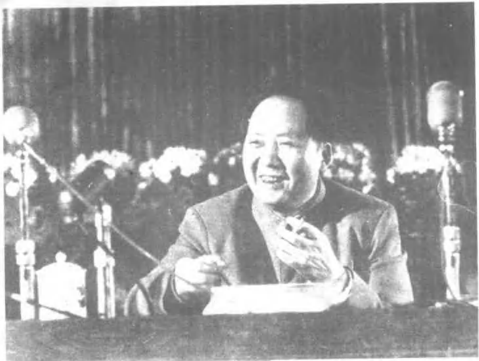
1955年，毛泽东在中国共产党的全国代表会议上。