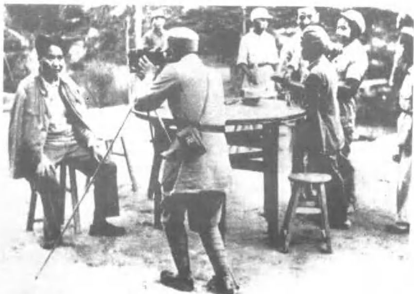
1945年，摄影师吴印咸为毛泽东照像。