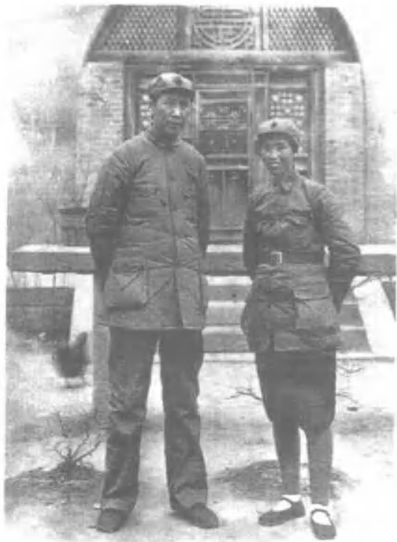
1937年春，毛泽东和 贺子珍在延安。