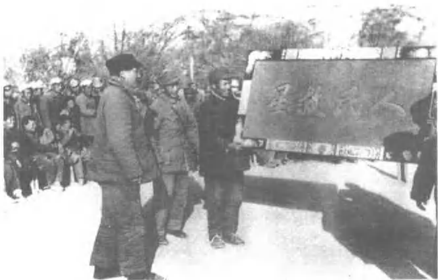
一九四六年，延安军民向毛泽东献金匾。