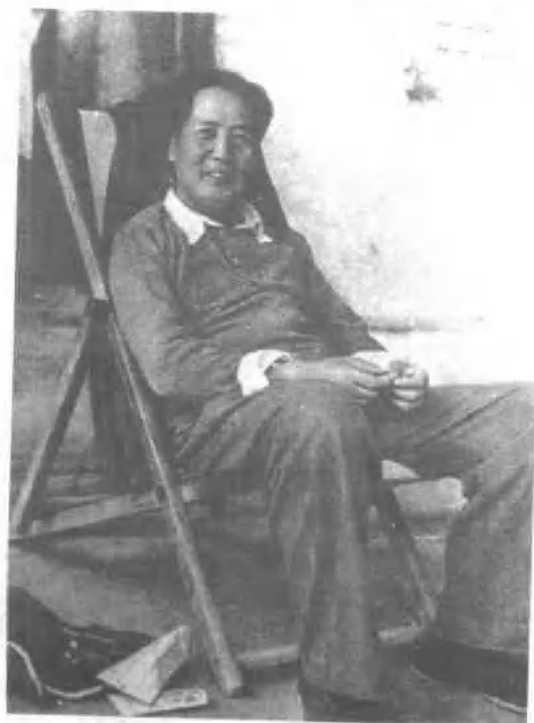
1948年，毛泽东在西柏坡。