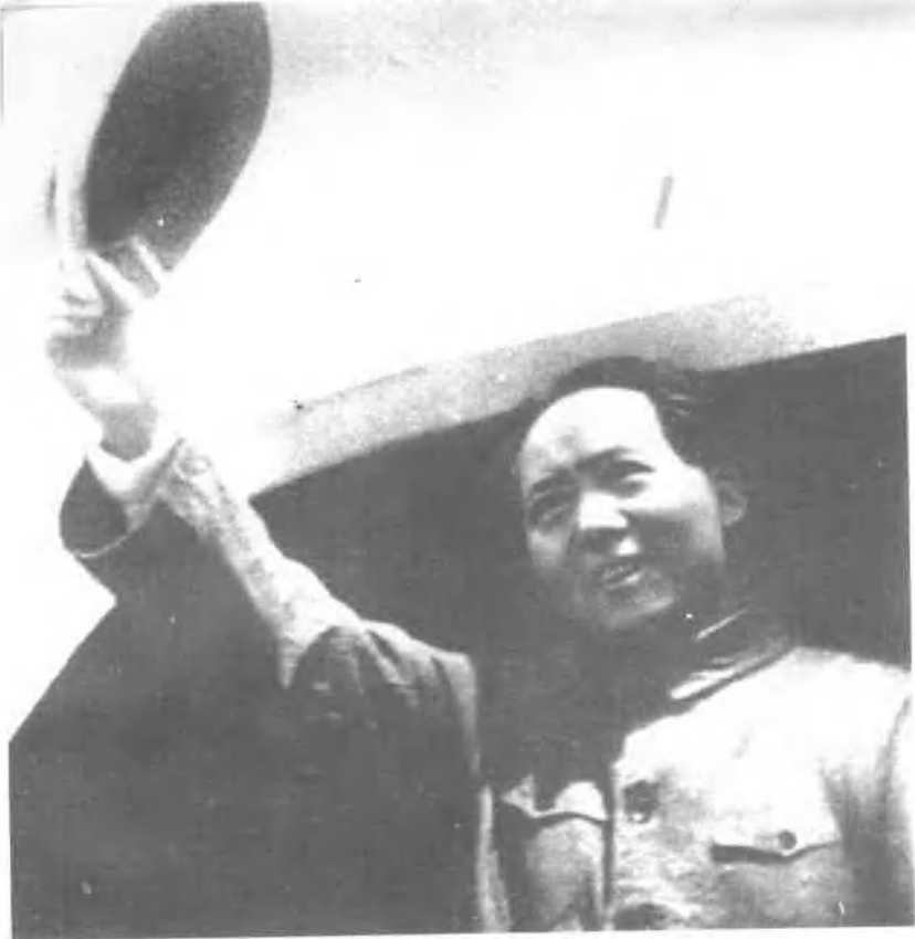
1945年8月，为争取国内和平，毛泽东在周恩来等的陪同下亲赴重庆谈判。图为他在延安机场向送行的军民挥帽告别。