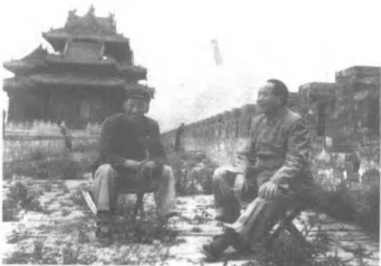
1954年5月。毛泽东在故宫城墙上远眺。