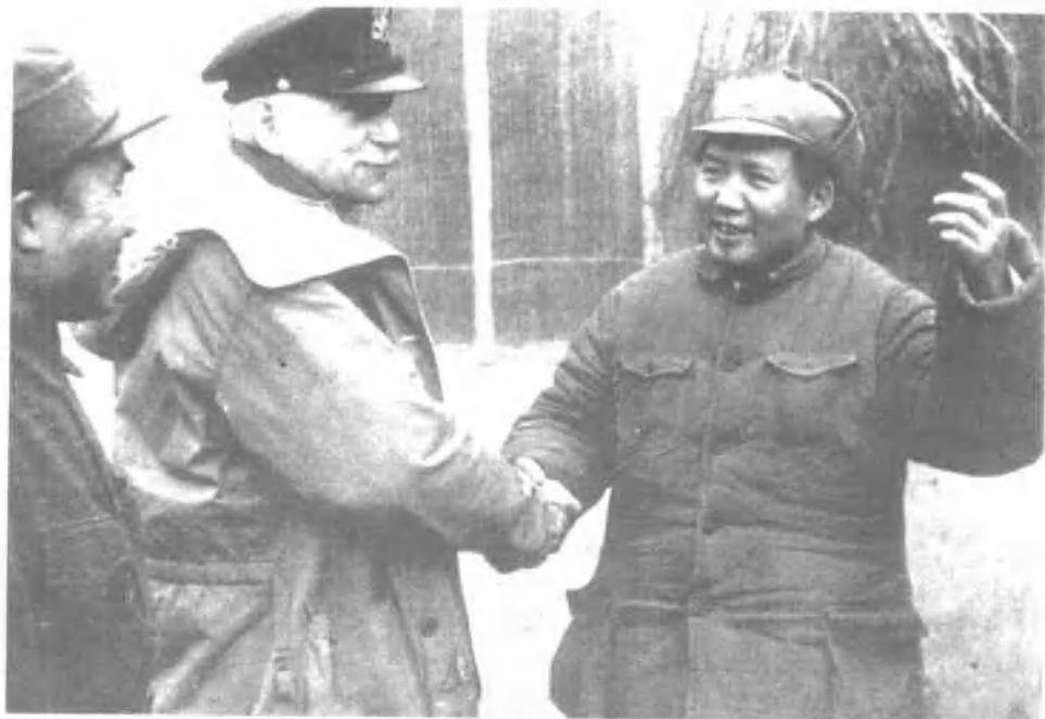
1944年11月，毛泽东和朱德在延安会见美国总统罗斯福的私人代表赫尔利。