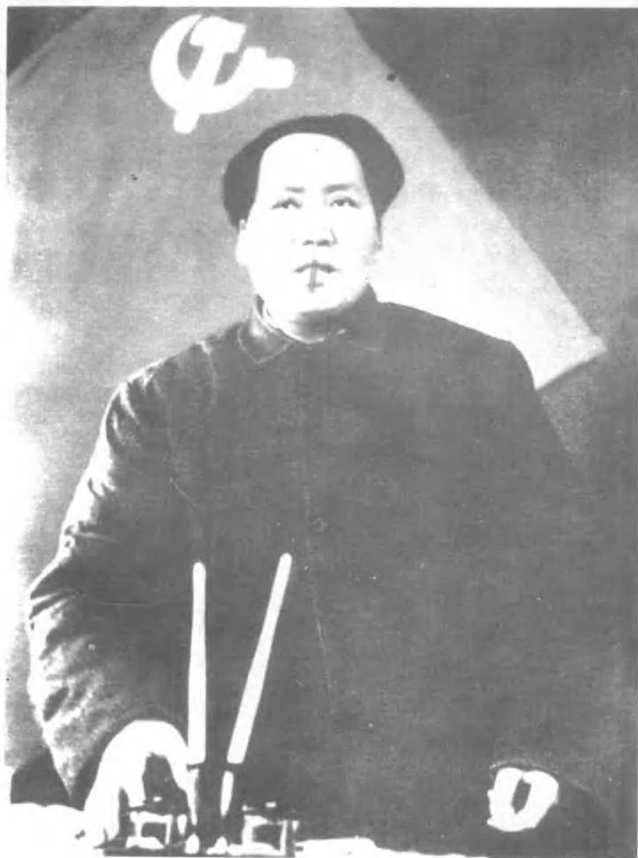
1949年，毛泽东在中共七届二中全会上作报告。