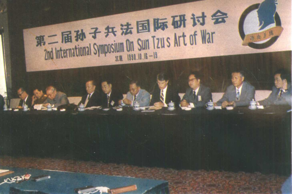
第二届孙子兵法国际研讨会开幕式主席台