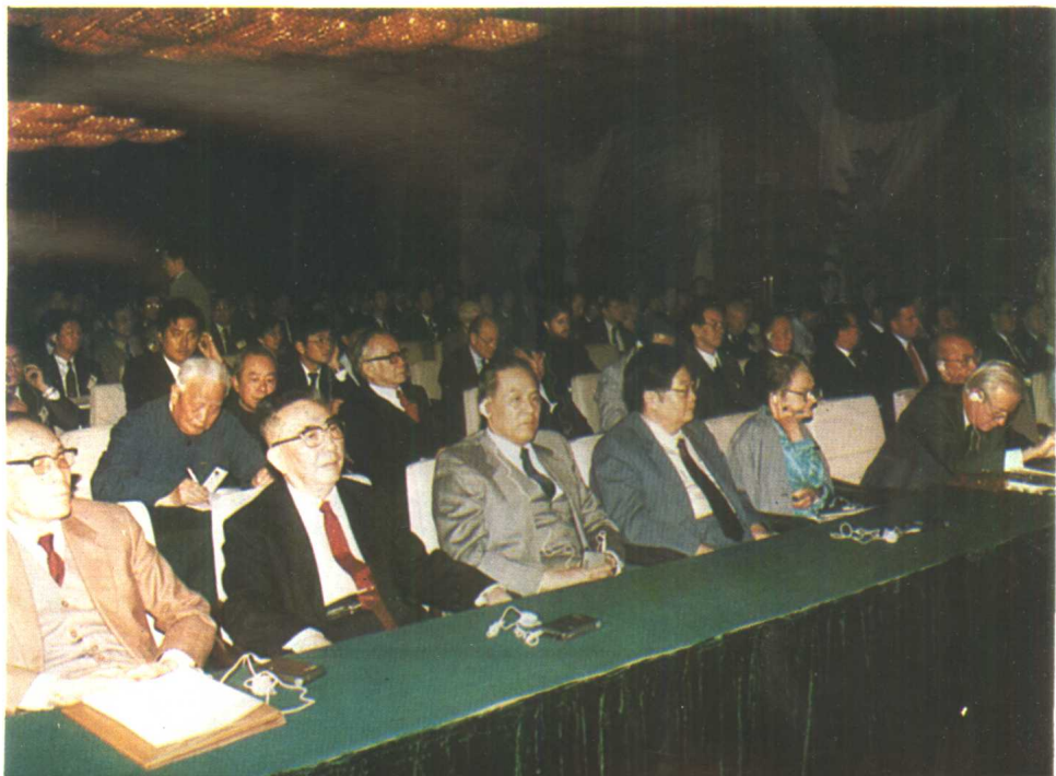
第二届孙子兵法国际研讨会大会一角