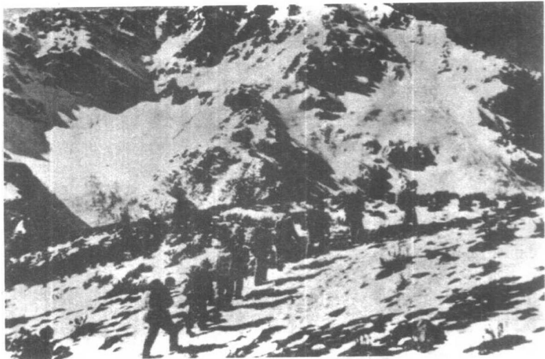
红军过大渡河后爬上西藏边界的大雪山