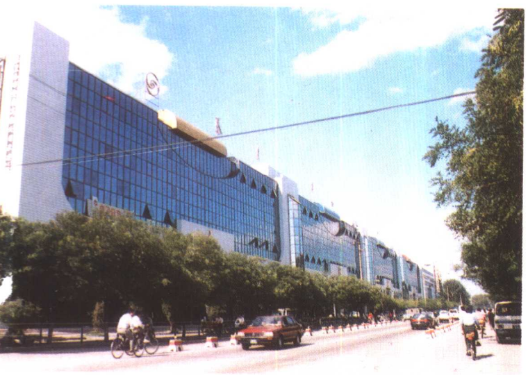
左上: 信谊大酒店 左中: 轻工大厦 左下: 渤海湾市场 右上: 物资交易中心