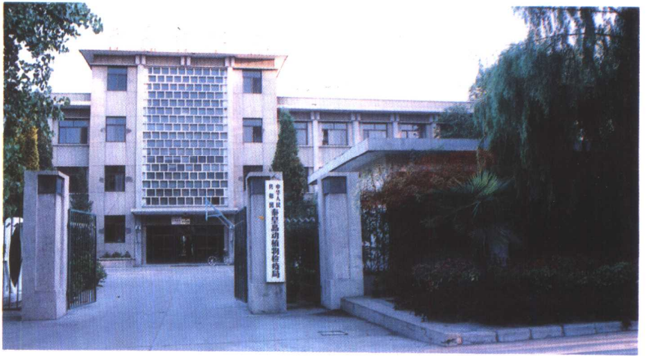
上: 中华人民共和国 秦皇岛海关