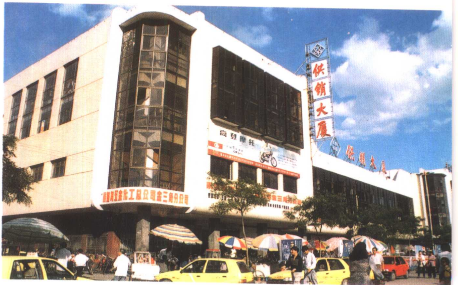
上: 秦皇岛市金三角市场 中: 秦皇岛百货大楼 下: 秦皇岛市供销大厦