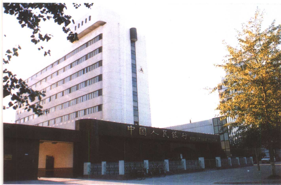
左上: 中国人民银行秦皇岛分行 左下: 中国农业银行秦皇岛分行 右下: 中国工商银行秦皇岛分行 信托投资公司