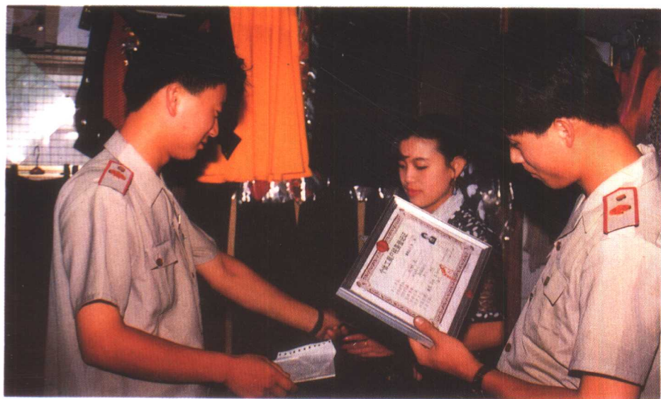
上: 税务检查 中: 工商检查 下: 物价检查