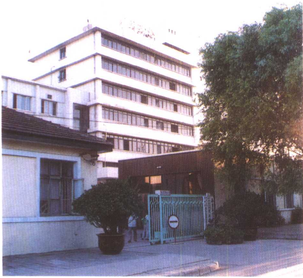
上: 中华人民共和国 秦皇岛商检局 下: 秦皇岛经济技术 开发区