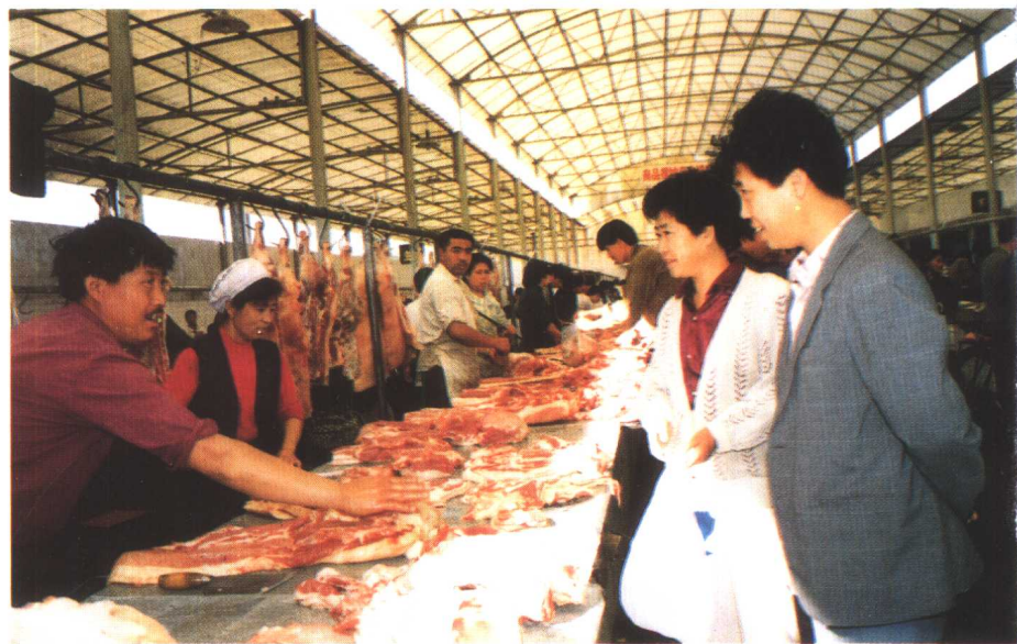
上: 菜市场 中: 农村集市 下: 菜市场