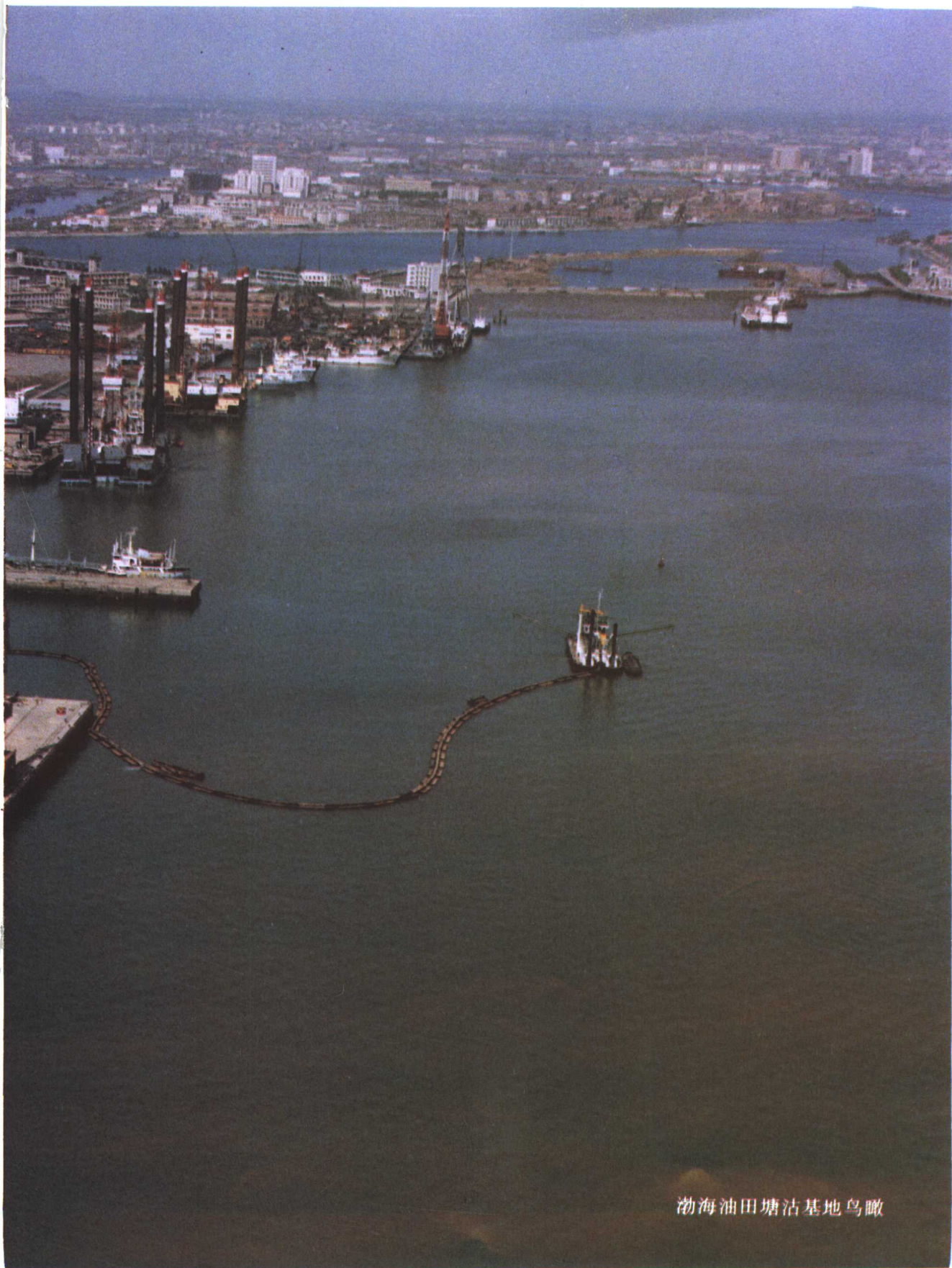
渤海油田塘沽基地鸟瞰