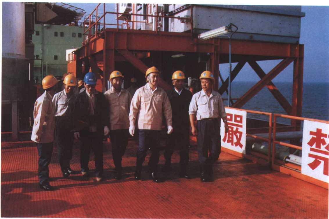
1990年7月，能源部部长黄毅诚同志视察渤海渤中34-2/4E油田