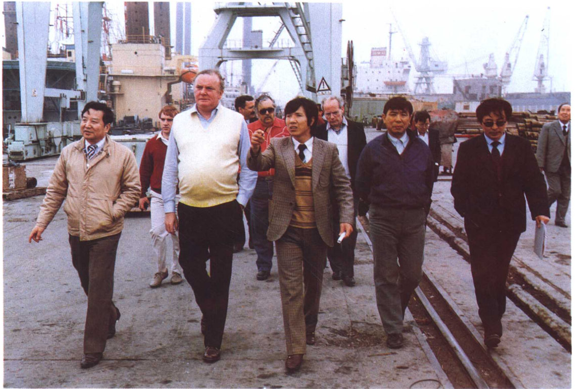
1989年4月，英国能源大臣莫雷森先生访问渤海油田