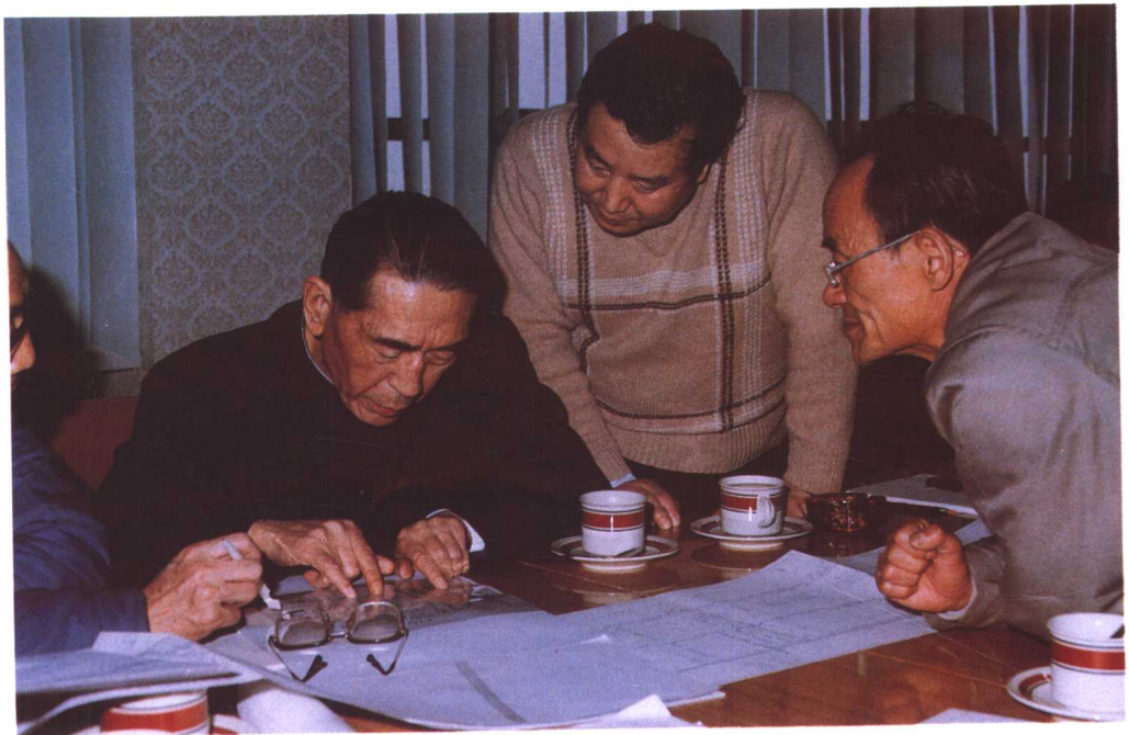
1985年4月,国务委员康世恩同志视察渤海油田,听取勘探开发工作汇报