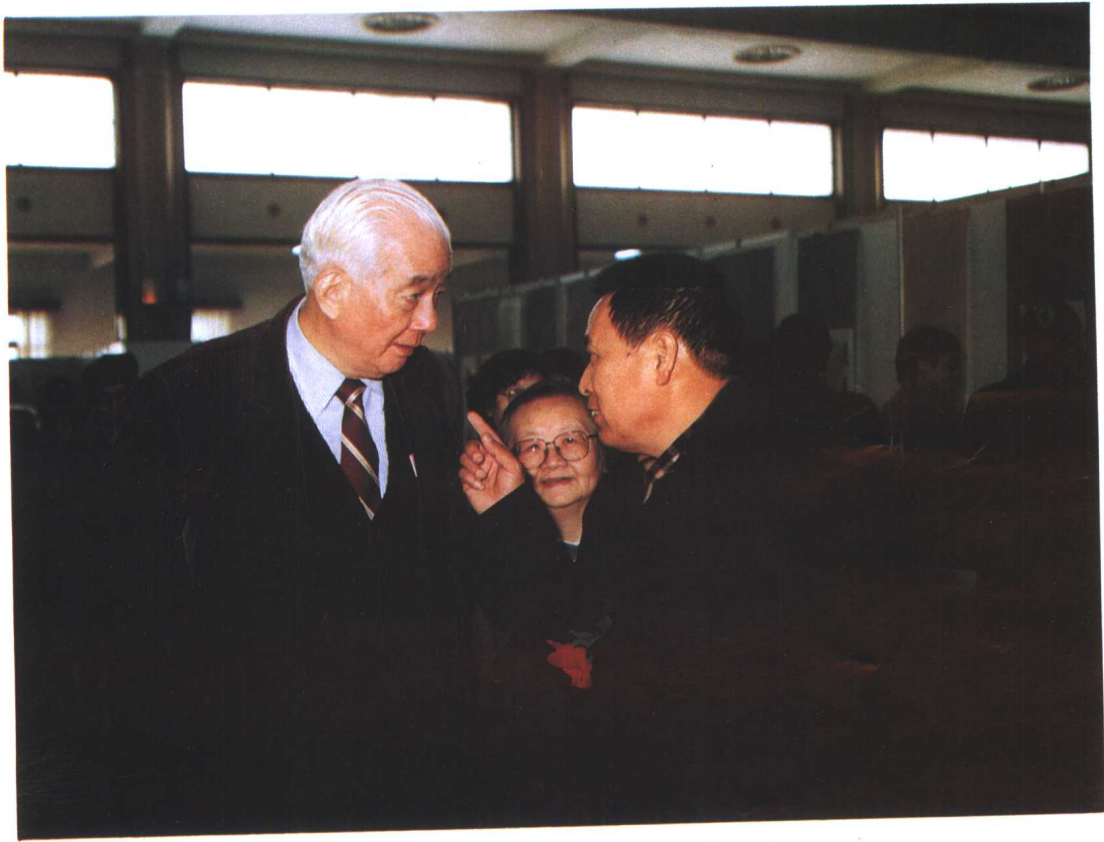
唐克同志与油田领导同志亲切交谈