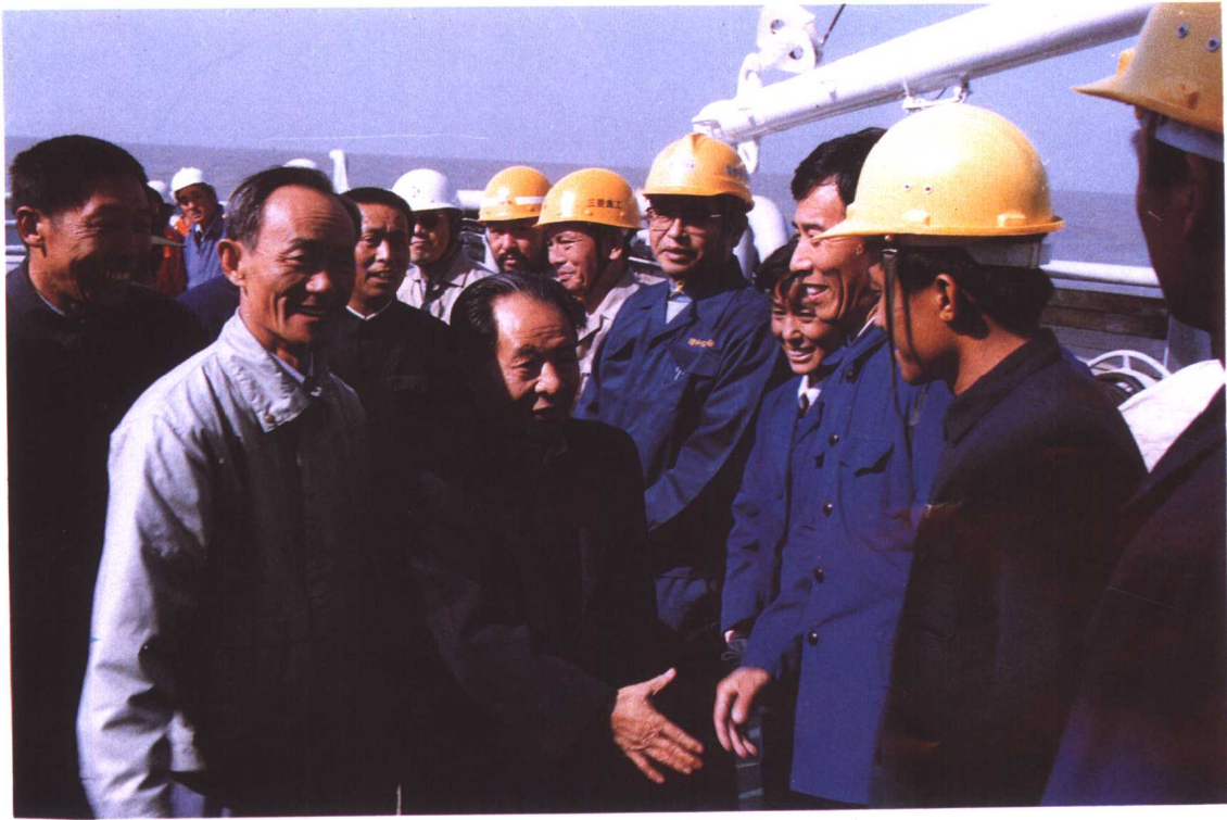
1984年10月,胡耀邦同志视察渤海油田