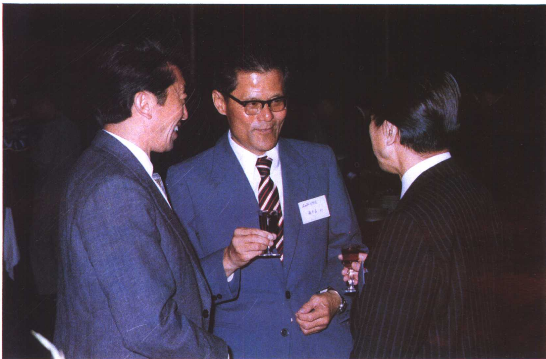
赵宗鼎同志出席渤海石油合同签字仪式