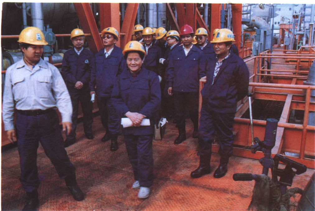
1991年6月，国家九部委领导人视察渤海渤中28-1油田