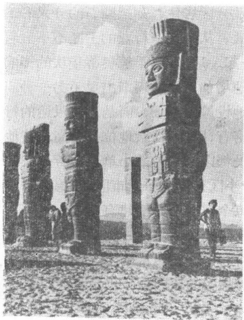
图拉城中的武士柱

加,城郊的粮食及其它物品供不应求。同时,农民向城市提供的劳务也因城市的发展而感匮乏。因此,城乡关系的紧张带来了一系列社会问题,使德奥蒂华坎的社会组织失去平衡。另一方面,在墨西哥高原上,同一时期又出现了与德奥蒂华坎类似的两个城市,一个叫乔卢拉,另一个叫索契卡尔戈。这两个新兴城市后来居上,发展极为迅速。因此,托尔蒂克的文化影响也就随之减弱了。