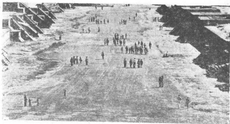
德奥蒂华坎城的“亡人大路”

德奥蒂华坎城在建筑上独具一格，房屋、庙宇都用石块砌成，外涂白灰。墙上装饰着各种壁画，常见的是人们想象中的走兽。市中心的南北通衢大路，全长两公里，宽四十米。大路两旁有很多坟墓，故称“亡人大路”。托尔蒂克人常以此为聚会或举行宗教仪式的场