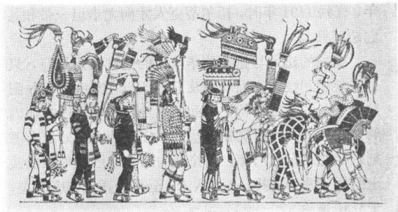
莫克特祖玛出行图

阿兹特克人的首领莫克特祖玛 ① 有两个儿子，他临终时把都城交给了长子圭斯特卡斯管辖。名叫墨西的幼子为了避免与兄长发生纠葛，加之怀念故土图拉城，遂于1069年率领七个氏族从居住地出发南下。经过席尔华坎时，又有契契梅卡、德纳卡巴、索契米尔卡等八个氏族要求加入他们的队伍。