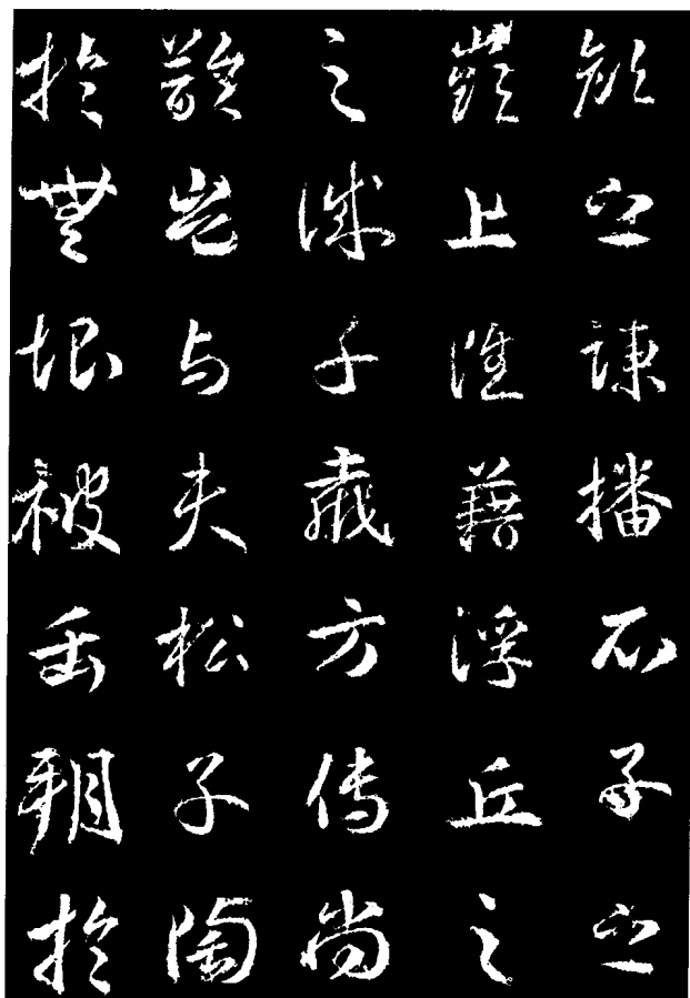
武则天·升仙太子碑