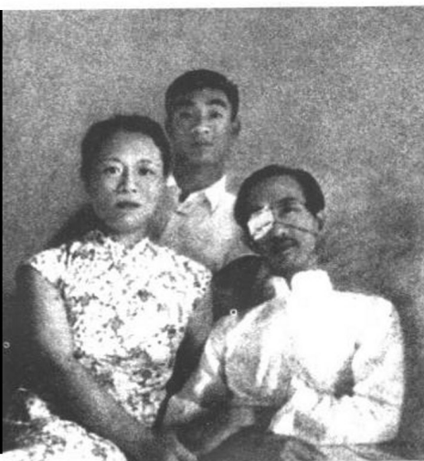
韬奋在病中和夫人沈粹缜 及长子嘉骅合影