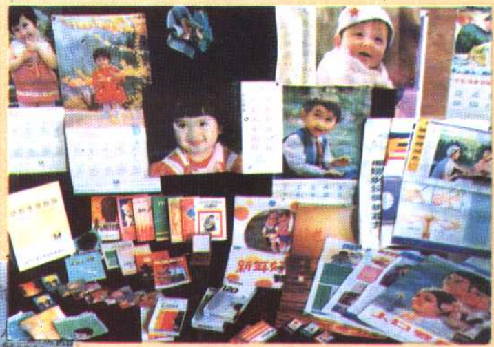
⑳ 各种形式的计划生育宣传品