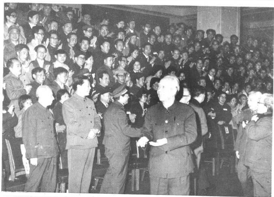
② 万里副总理在全国计划生育双先会上接见全体代表。