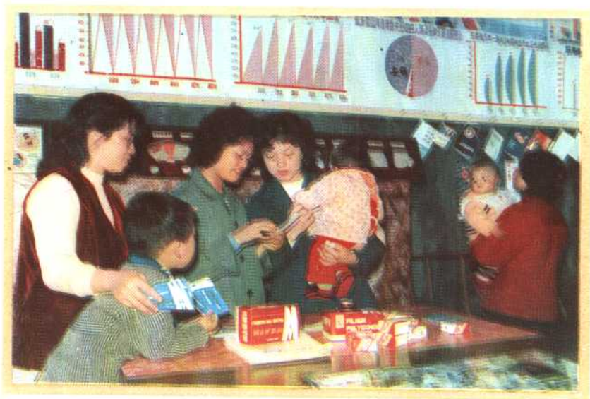
⑫ 在厂矿、基层指导避孕药具的使用。