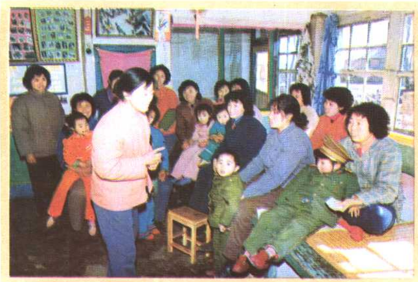
⑨ 辽宁省铁岭县阿吉镇白沙村的计划生育中心户，组织育龄妇女开展多种多样的活动，促进了计划生育工作的开展。图为中心户的育龄妇女正在开故事会。