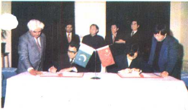
⑱ 中国、巴基斯坦计划生育合作议定书在北京签字。