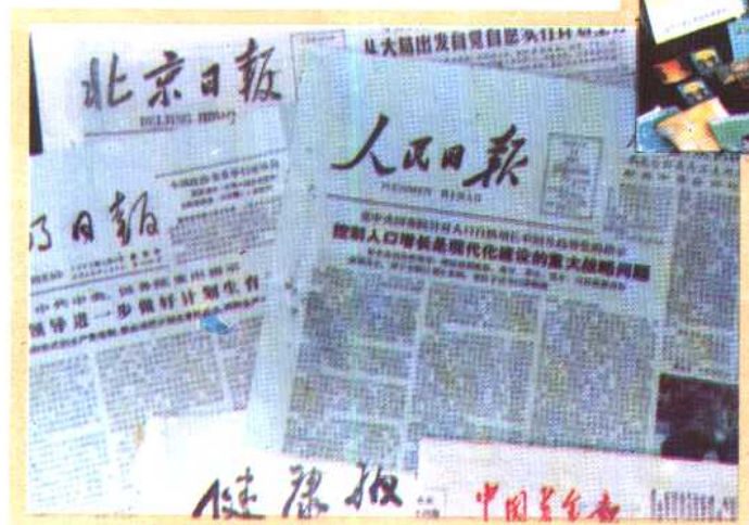
㉑ 利用报纸进行计划生育宣传。