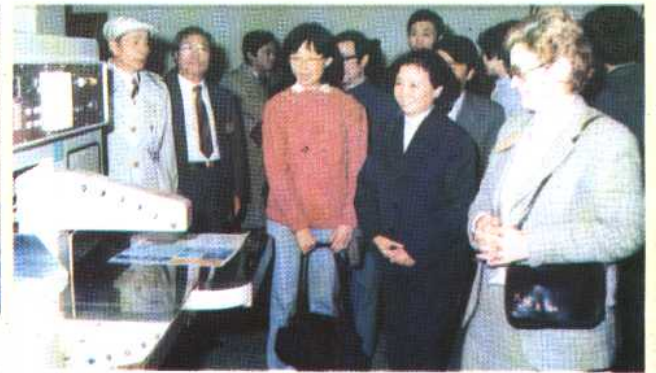
⑳ 出席全球人口情报网会议的代表在中国人口情报中心主任陪同下参观该中心的印刷设备。