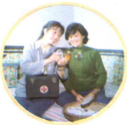
⑬ 把避孕药具送到炕头。