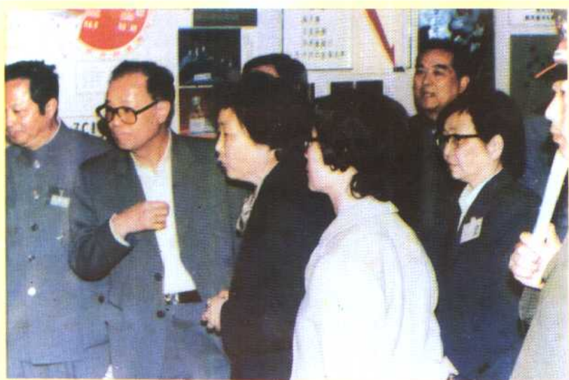
③ 受国家计划生育委员会之托，上海承担了国家“六五”科技攻关成果展览会的计划生育馆的筹展和参展工作。1986年5月15日晚，赵紫阳总理等党和国家领导人参观了展览，听取了汇报，满意地连说：“很好，很好！”