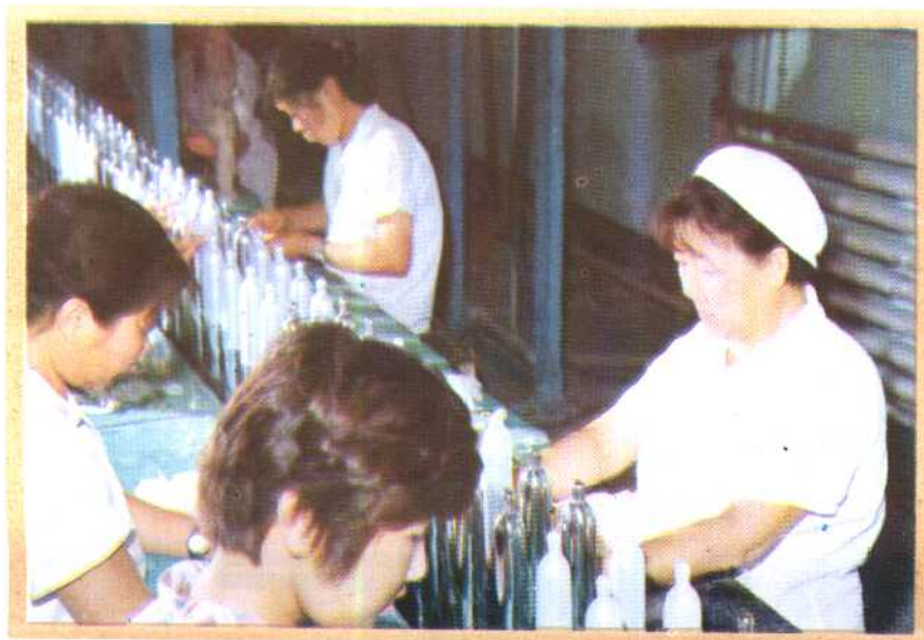
⑪ 天津乳胶厂在生产避孕药具。