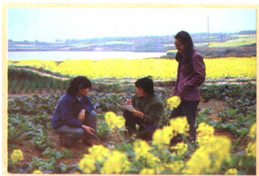
⑩ 安徽省肥西县计划生育干部在田间进行计划生育调查。