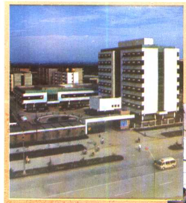
㉒ 四川省计划生育管理干部学院全景。