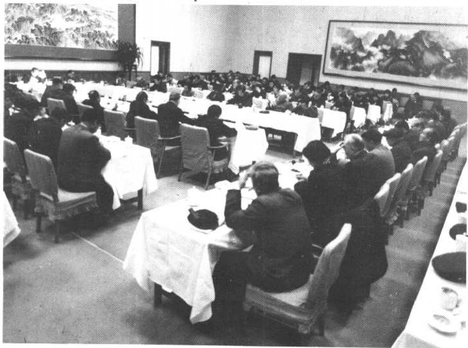
① 1986年12月1日至5日在北京召开了全国计划生育工作会议，赵紫阳总理作了重要讲话。图为会场一角。