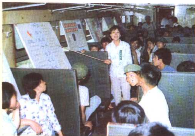
③② 在列车上向旅客进行计划生育宣传。