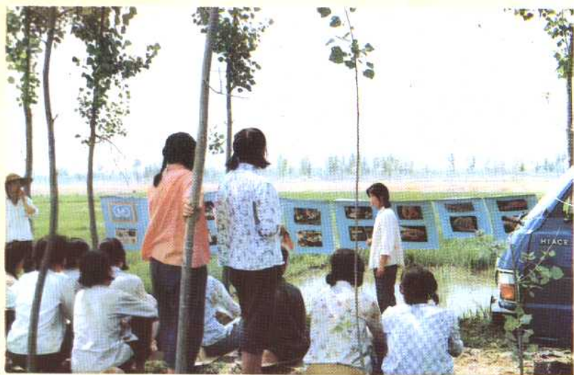
③① 在农村地头进行计划生育宣传。