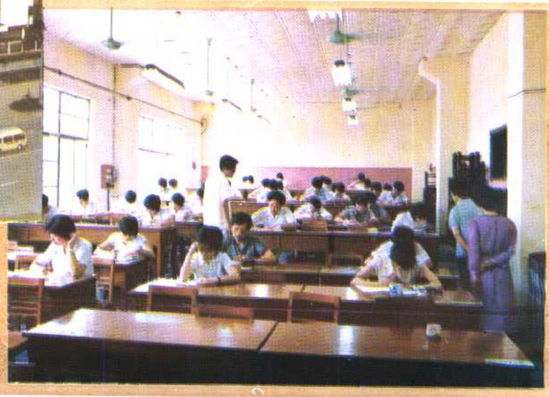
㉓ 南京计划生育管理干部学院的学员在认真学习。