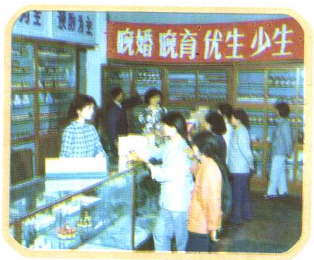
⑭ 设立多渠道避孕药具发放点。 (北京计划生育宣传教育中心供稿)