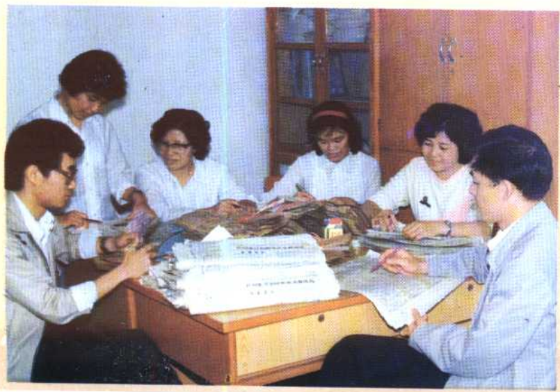
③④ 广西壮族自治区计划生育委员会把开展《计划生育知识竞赛》活动作为加强计划生育宣传的一项内容来抓，参加答卷的群众十分踊跃。图为工作人员正在分理答卷。