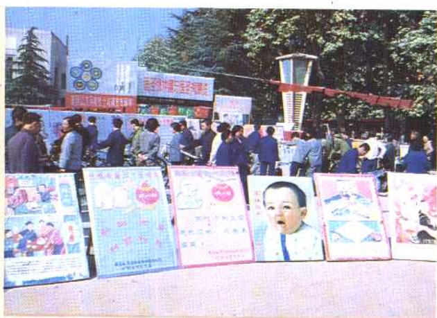
③③ 郑州市金水区1986年元旦至春节期间在街头广场办的计划生育图画宣传栏，受到群众欢迎。