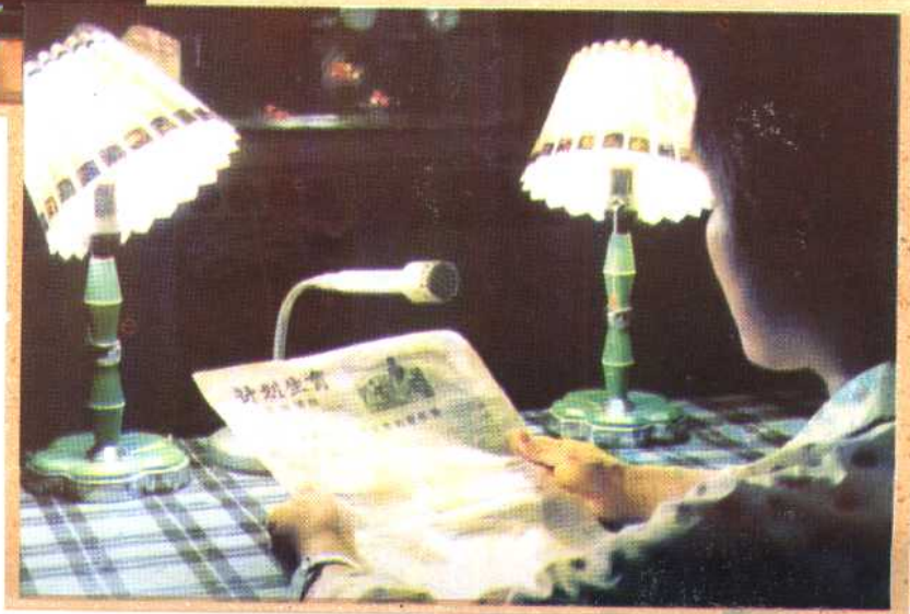
㉓ 河北省乐亭县在进行广播宣传