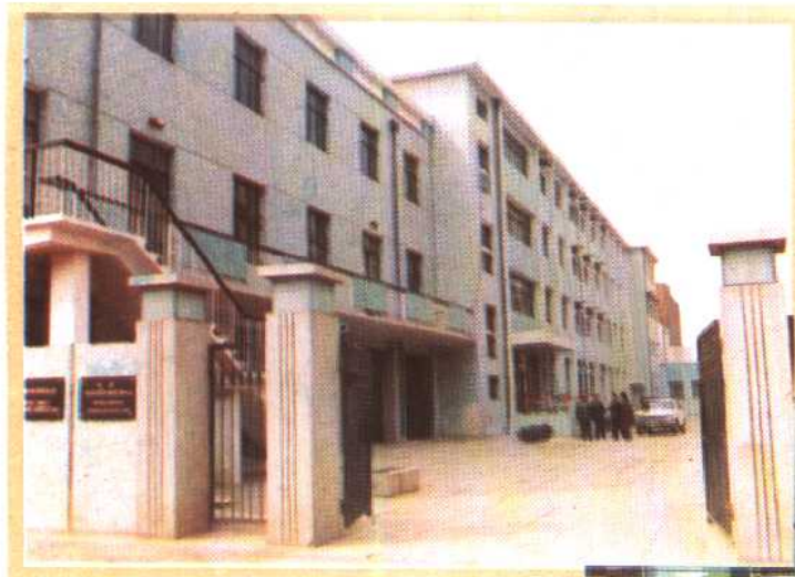
⑳ 北京计划生育宣传教育中心、中国计划生育协会新址。