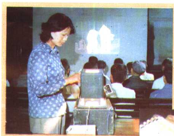
㉒ 利用幻灯进行计划生育宣传。