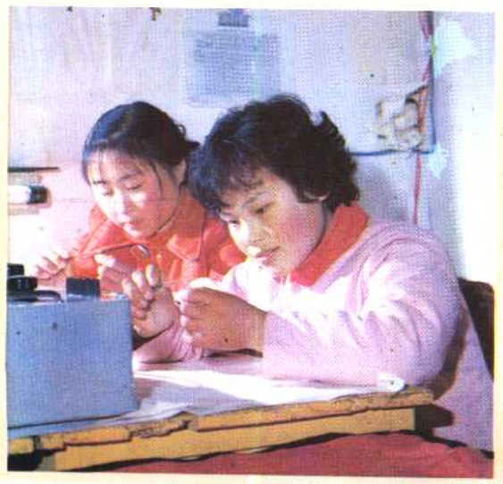
⑧ 安徽省大长县扶植独生子女户致富。