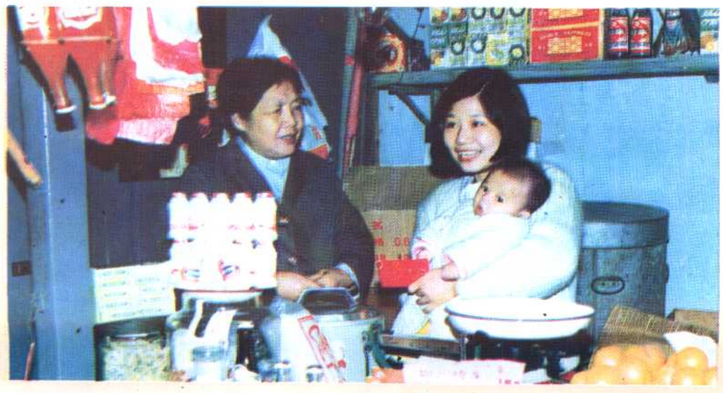
⑱ 广州市东山区梅花街13居委主任把保健费送到个体户手中。