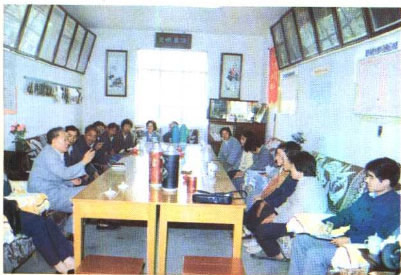
⑦ 1986年10月17日，国家计划生育委员会主任王伟同志在江苏省张家港市锦丰乡兴联村召开的独生子女家长座谈会上，与独生子女家长亲切交谈。