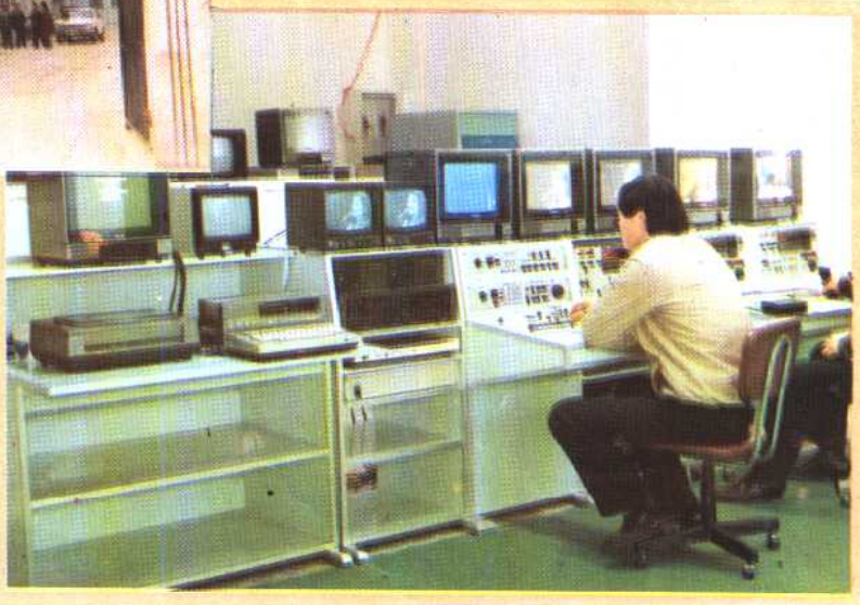
㉑ 联合国人口活动基金提供福建省计划生育宣传培训中心的视听设备已安装完毕，并已投入制作计划生育电视节目。