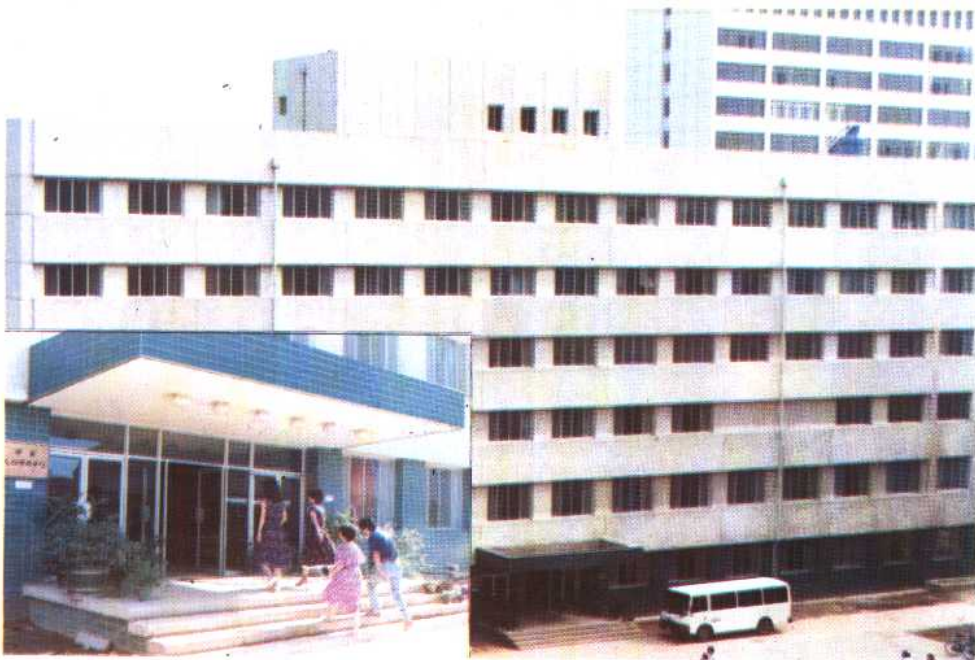
㉑ 1986年竣工的中国人口情报中心大楼。