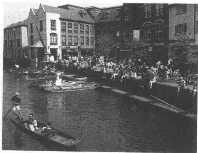
Modern Quayside today