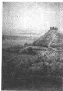
The Danes arrive

How did Cambridge get its name? The city stands on the River Cam. Part of this river is called the Granta. By 875, there was a bridge over the river. So the place was called Grantabridge. And later it was called Cambridge.