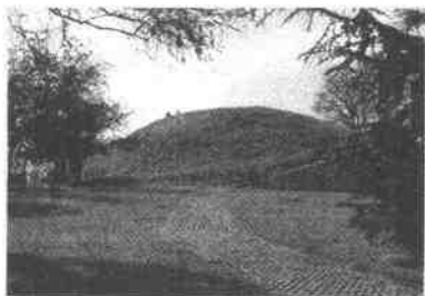
The Castle Mound, the ruin of King William's castle in Cambridge

Soon many religious people came to live in Cambridge. They built hospitals and churches. By the end of the eleventh century, Cambridge was an important religious centre.