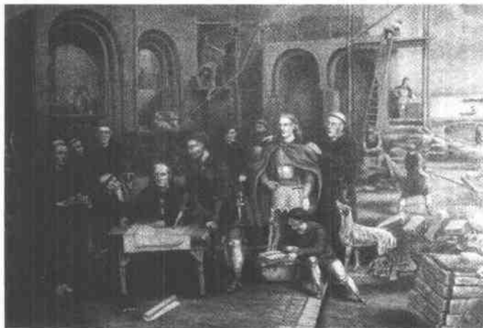
The Normans built Ely Cathedral

In 1066, William of Normandy came to England. The Norman army defeated the English army. William became king of England. He built strong castles in many parts of England. He built one at Cambridge. You can see the bridge and castle on the coat of arms.