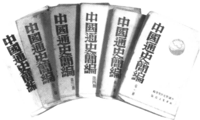
1943年新华书店六卷本《中国通史简编》书影