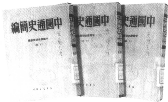
1949年新华书店三卷本《中国通史简编》书影