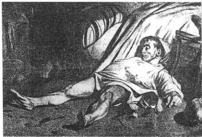
图④ 1834年4月15日的特朗斯诺宁街

发指的场面：包括婴孩在内，某工人全家老小悉数被杀。横贯画面主体位置的一家之主仰躺在血泊里，仅穿的睡衣说明屠杀发生在沉沉黑夜，脸贴地趴着的婴儿被压在父亲身下，两侧的阴影里是老人和妇女的尸体。昏暗和苍白的光影对比强化了恐怖与凄怆气氛，真是惨不忍睹，让人不寒而栗！