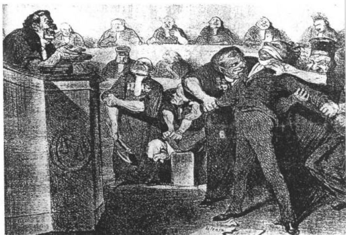
图③ 有话就请说吧，你们是自由的

菲力普王朝的最初几年，里昂和巴黎相继发生的工人暴动均遭残酷镇压，不仅起义者被屠杀，连劳工区的居民也受株连。漫画《1834年4月15日的特朗斯诺宁街》(图④)从一个侧面展现了令人