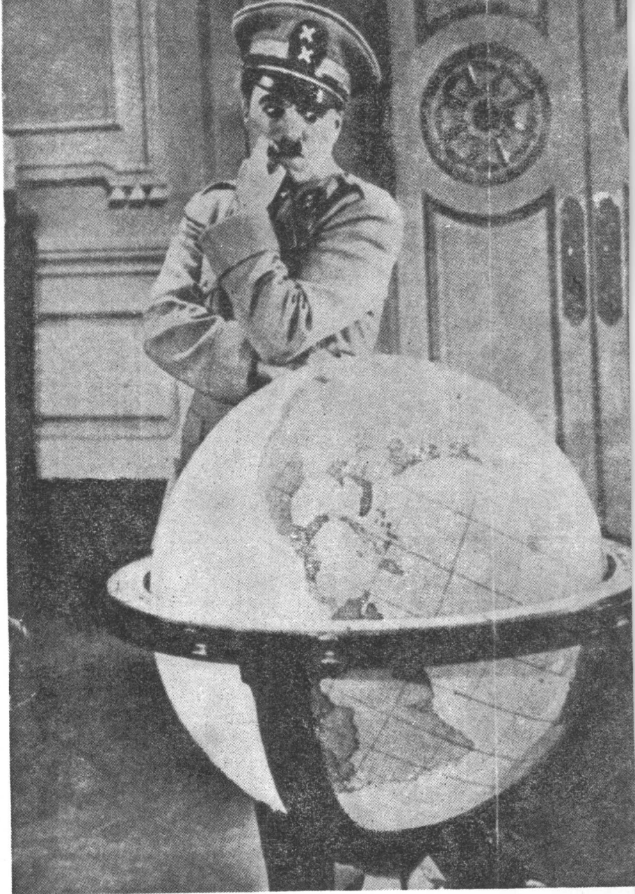
兴格尔呆呆地望着地球仪