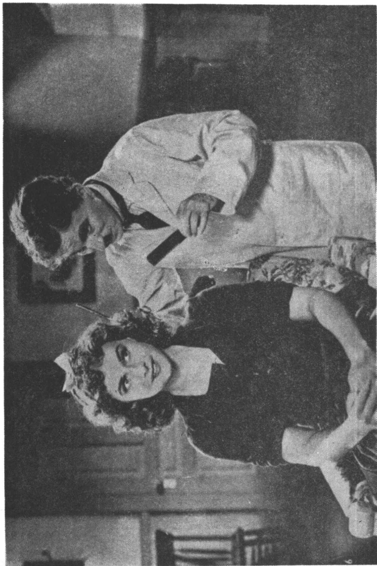
犹太理发师和哈娜