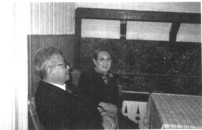
1987年6月访问联邦德国，与夫人姚可昆在海德堡鸣池街15号旧居的凉台上