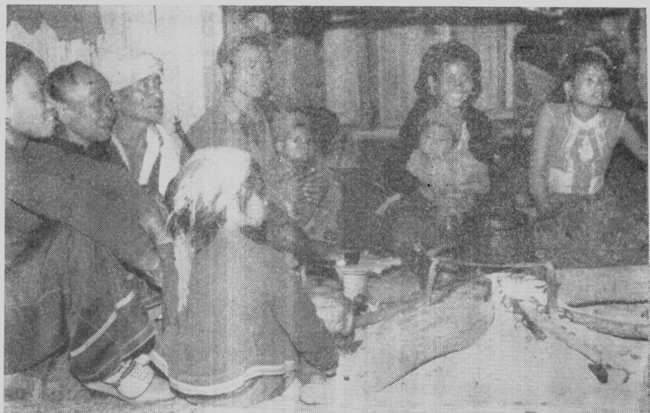
布朗族一家（布朗山区）