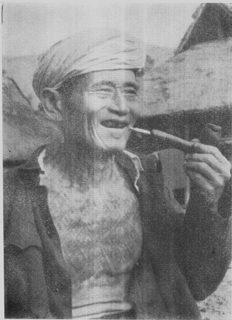
文 身 (布朗山区)