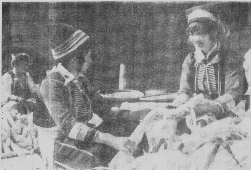
收 获 (施甸)