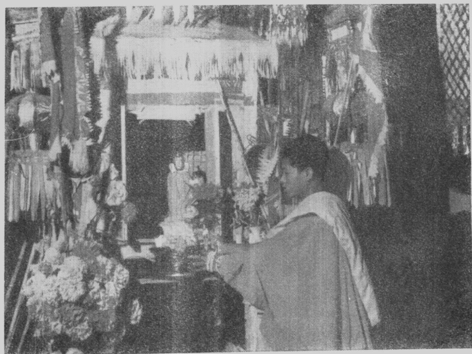
緬寺佛壇（西双版纳）