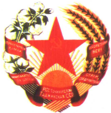
塔吉克苏维埃 社会主义共和国