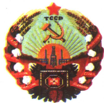
土库曼苏维埃 社会主义共和国